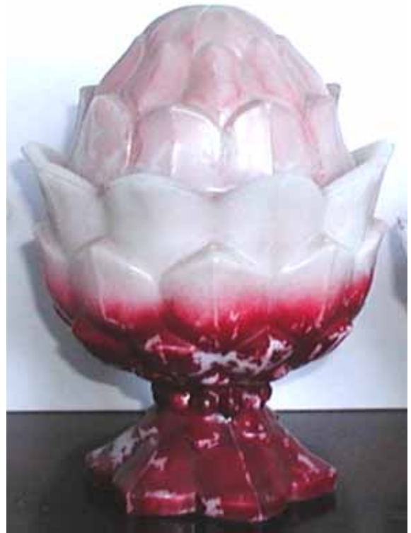
Abb. 2003-4/089 Deckeldose Artischocke opak-weißes Pressglas, kalt bemalt, H 14 cm, D 10 cm Sammlung Fehr Vallérysthal / Portieux, um 1900 s. MB Vallérysthal 1908, Pl. 305, Nr. 3775