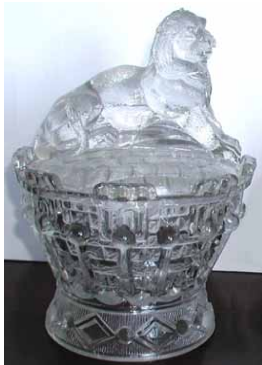
Abb. 2003-4/101 Deckeldose als Löwe auf einem Korb (?) farbloses Pressglas, H 19 cm, D 14 cm Sammlung Fehr s. MB Bayel / Fains 1923, Seite 97, Tafel 40, Nr. 1826 s. PK Abb. 2003-3/315