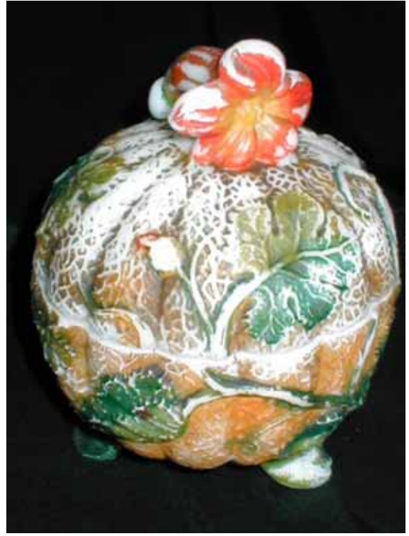
Abb. 2003-4/082 Deckeldose als Melone (Kürbis) mit Trompetenblüte, Blättern und Ranken opak-weißes Pressglas, kalt bemalt, H 14 cm, D 10,2 cm Sammlung Vogt Hersteller unbekannt, Frankreich oder Belgien, um 1900 s. MB Val St. Lambert, 1897, Planche 41, Sucriers, Nr. 28 (Abb. 2000-1/023) innen eingepresst „SV“