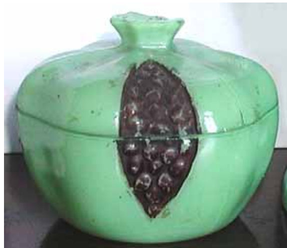
Abb. 2003-4/085 Deckeldose als aufgesprungener Granatapfel opak-grünes Pressglas, kalt bemalt, H 8,5 cm, D 10,5 cm Sammlung Fehr Vallérysthal / Portieux, um 1900 s. MB Vallérysthal 1913, Tafel 8, Diverse Artikel, kalt bemalt oder bronzirt, Zuckerdose „Granatapfel“