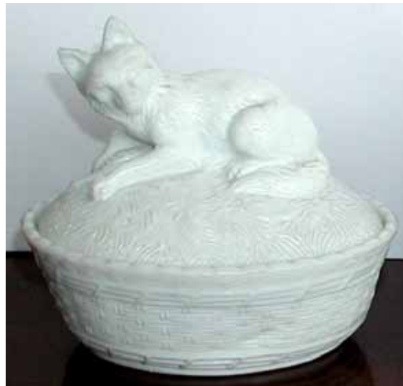
Abb. 2003-4/093 Deckeldose als Fuchs auf einem Korb opak-weißes Pressglas, H 11,5 cm, D 13 cm Sammlung Fehr Hersteller unbekannt, Frankreich, Deutschland, USA, um 1900