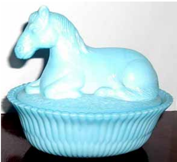
Abb. 2003-4/100 Deckeldose als Pferd auf einem Korb opak-weißes (u. opak-hellblaues) Pressgl., H xxx cm, L xxx cm Sammlung Fehr Jahresgabe NMGCS 1989, Summit Art Glass Co., USA s. Chiarenza 1998, S. 12 f., S. 181: Basis ursprüngl. McKee ähnlich MB Streit 1913, Tafel 15, Nr. 1754, L 14 cm, hell- weiß u. türkisblau (Fehr: Reproduktion nach McKee)