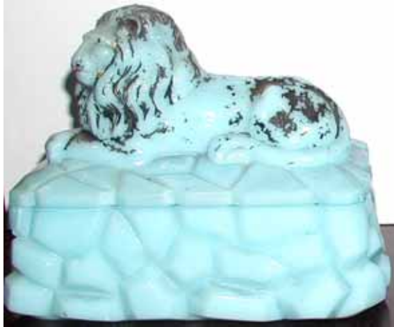
Abb. 2002-2-1/009 Schein-Deckeldose als Löwe auf einem Felsensockel hellblaues Pressglas, H 12 cm, B 9 cm, L 15 cm im hohlen Sockel eingepresste Inschrift „MEISENTHAL“ Sammlung Roese HR-328 nicht in den Musterbüchern Meisenthal 1907 und 1927 ent- halten soll vermutlich den „Löwen von Belfort“ darstellen