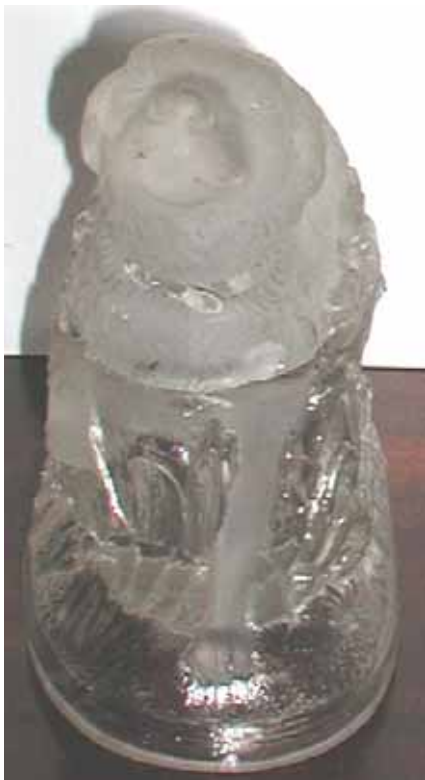
Abb. 2003-4/106 Figur Hund auf einer Wiese farbloses Pressglas, mattiert, H xxx cm, D xxx cm Sammlung Fehr Hersteller unbekannt, Frankreich, um 1900, wohl Baccarat