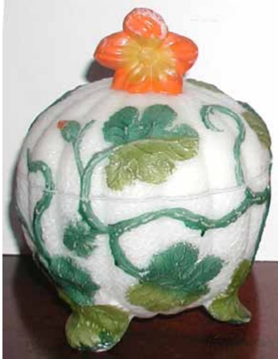
Abb. 2003-4/080 Deckeldose als Melone (Kürbis) mit Trompetenblüte, Blättern und Ranken opak-weißes Pressglas, kalt bemalt, H 14 cm, D 10,2 cm Sammlung Fehr Hersteller unbekannt, Frankreich oder Belgien, um 1900 s. MB Val St. Lambert, 1897, Planche 41, Sucriers, Nr. 28 (Abb. 2000-1/023) unten eingepresst „SV“ s. Slg. Vogt, Abb. 2003-4/081 u. / 082, innen Marke „SV“