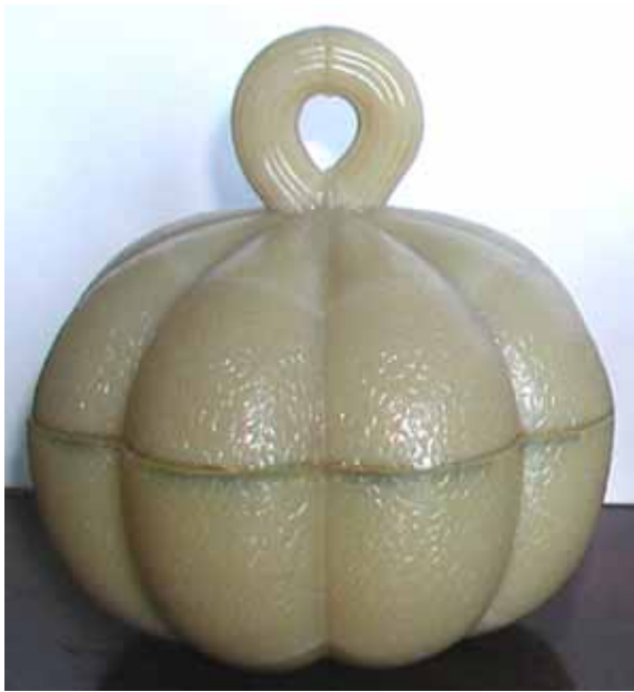
Abb. 2003-4/083 Deckeldose als Kürbis (Melone?) opak-hellbraunes Pressglas, H 12 cm, D 11,5 cm Sammlung Fehr Vallérysthal / Portieux, um 1900 s. MB Vallérysthal 1908, Pl. 304, Nr. 3762