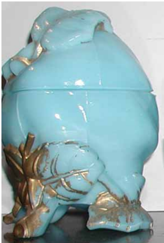
Abb. 2003-4/088 Deckeldose als Quitte (Apfel?) mit Blättern opak-hellblaues Pressg., kalt vergoldet, H 14,5 cm, D 10 cm Sammlung Fehr Vallérysthal / Portieux, um 1900 s. MB Vallérysthal 1908, Pl. 305, Nr. 3765