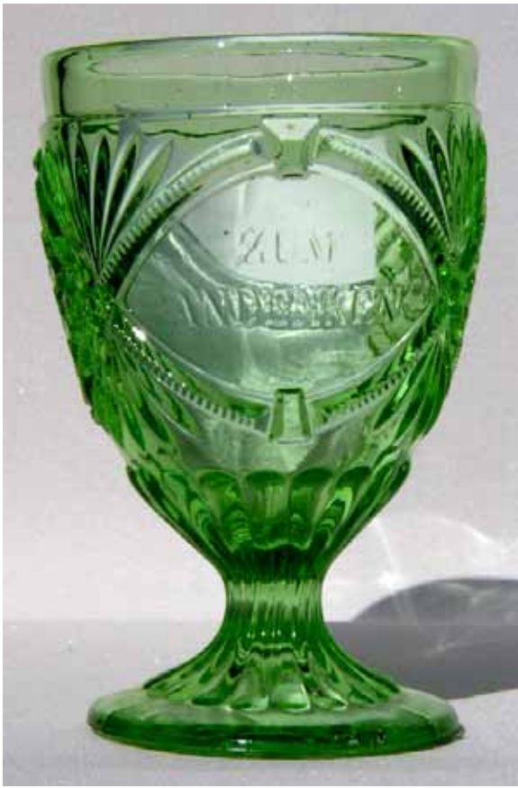
Abb. 2003-2/172 Fußbecher / Freimaurer Inschrift „ZUM ANDENKEN“ grünes Pressglas, H 12,5 cm, D 7,8 cm Sammlung Geiselberger PG-530 s. Musterbuch Villeroy & Boch 1898, Tafel 210, Fig. 29