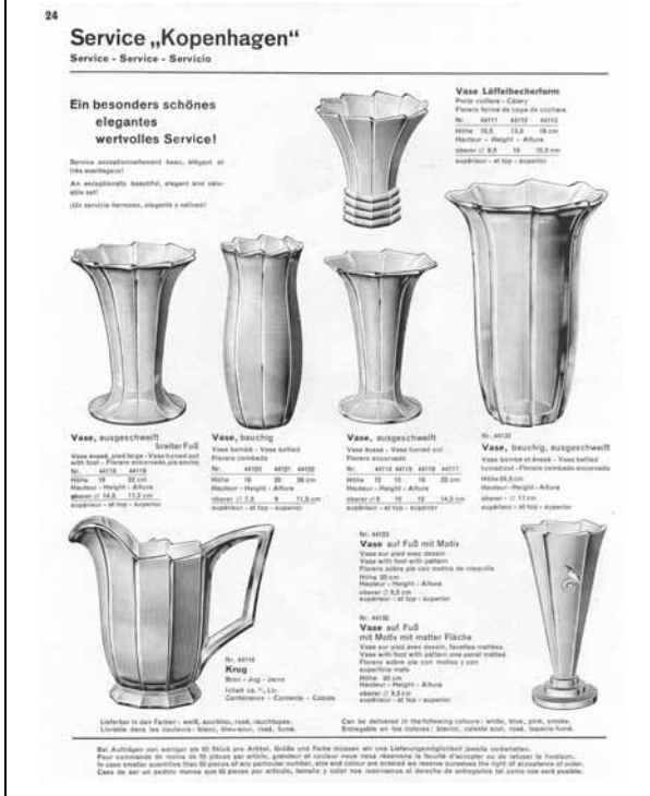
Abb. 2001-3/315 Musterbuch Walther 1934, Tafel 7 Achat-Kunstglas Oralit Zentrum, Hermann, Kopenhagen, Rheingold, Herz, Olga, Hufeisen, Muschel, Paula, Xenia, Liane, KDG Sammlung von Spaeth