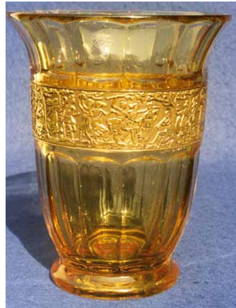
Abb. 2001-2/090 a Traubenspüler mit Relief-Band u. aufgetriebenem Rand bernstein-gelbes Pressglas, H 16 cm, D 12,8 / 7,6 cm Sammlung Hosch A. Walther & Söhne AG, um 1930 Marke „Walther D.R.P. ang.“ u. Herz m. Kreuz u. Punkten, MB-Nr. 41202