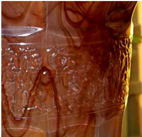
Abb. 2003-3/238 Vase, m. Relief-Band u. aufgetriebenem Rand braun (sepia) gewolktes Pressglas, H 16 cm, D 13 cm Sammlung Kik van der Linde A. Walther & Söhne AG, um 1930, ohne Marke s. MB Walther 1932, Tafel 79, Kunst-Dekor-Gläser, Traubenspüler Nr. 41202