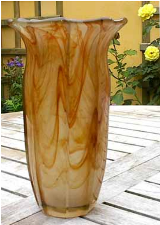
Abb. 2003-3/236 Vase, bauchig m. aufgetriebenem u. ausgeschnittenem Rand, gelb-braun gewolktes Pressglas, H 24 cm, D 17 cm Sammlung Kik van der Linde A. Walther & Söhne AG, 1934 s. MB Walther 1934, Tafel 24, Service Kopenhagen u. MB Walther 1934, Tafel 7, Achat-Kunstglas Oralit Zentrum, Hermann, Kopenhagen ..., Vase Nr. 31472

Der „Traubenspüler“ Nr. 41202 wurde nicht in den Standard-Farben der „Kunst-Dekor-Gläser“ „Amethyst, Bernstein, Grün mit Goldband“ gemacht, sondern aus „malachit-braunem“, gewolktem Glas und hat zwar den eingepressten Figuren-Fries, der aber nicht vergoldet wurde und auf dem Foto nicht gleich erkennbar ist..