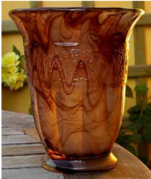
Abb. 2003-3/237 Vase, m. Relief-Band u. aufgetriebenem Rand braun (sepia) gewolktes Pressglas, H 16 cm, D 13 cm Sammlung Kik van der Linde A. Walther & Söhne AG, um 1930, ohne Marke s. MB Walther 1932, Tafel 79, Kunst-Dekor-Gläser, Traubenspüler Nr. 41202