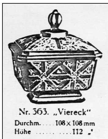
Abb. 1999-2/136 aus Franke 1990, Abb. 729 Musterbuch Fenne, um 1912, Tafel 46, Zuckerdosen Dose Nr. 363, „Viereck“, H 11,2 cm, L/B 10,8 cm

[...] Auf der Glasdose von meiner Frau habe ich nach einer Marke gesucht, doch ohne Erfolg. Ein Foto kann ich leider nicht schicken, da mein Apparat zu Weihnachten den Geist aufgab. Ich versuche die Dose aufzuzeichnen, wobei Zeichnen nicht meine Stärke ist. [Zeichnung M.S. / SG; immerhin ist es mit der Zeichnung gelungen, den Hersteller der Dose zu finden!]