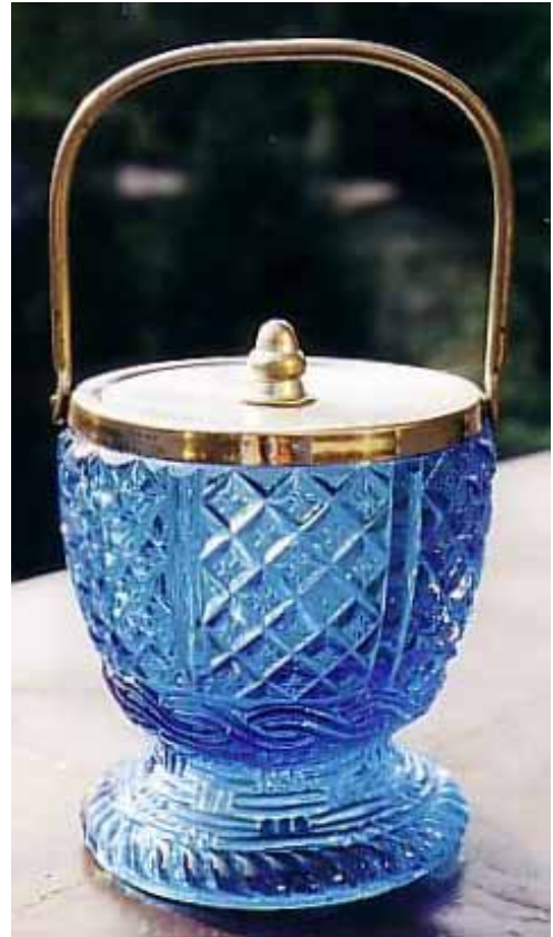
Abb. 2004-1/244 Dose mit Metall- Deckel, Pseudoschliff-Dekor blaues Pressglas, Glas H 7,5 cm, D 7,0 cm Sammlung Zeh Rittermarke, Gebrüder von Streit, Hosena-Hohenbocka, um 1900