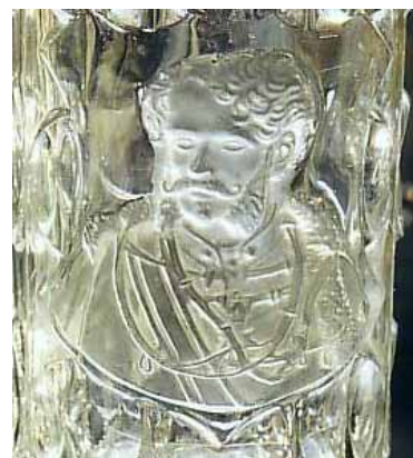
Abb. 2004-1/241 Becher Kaiser Franz Joseph I. von Österreich-Ungarn farbloses Pressglas, teilw. mattiert, H 15,4 cm, D 7,9 cm Sammlung Geiselberger, PG 617 Hersteller unbekannt, Böhmen / Österreich, 1898? s.a. Baumgärtner 1981, Abb. 371