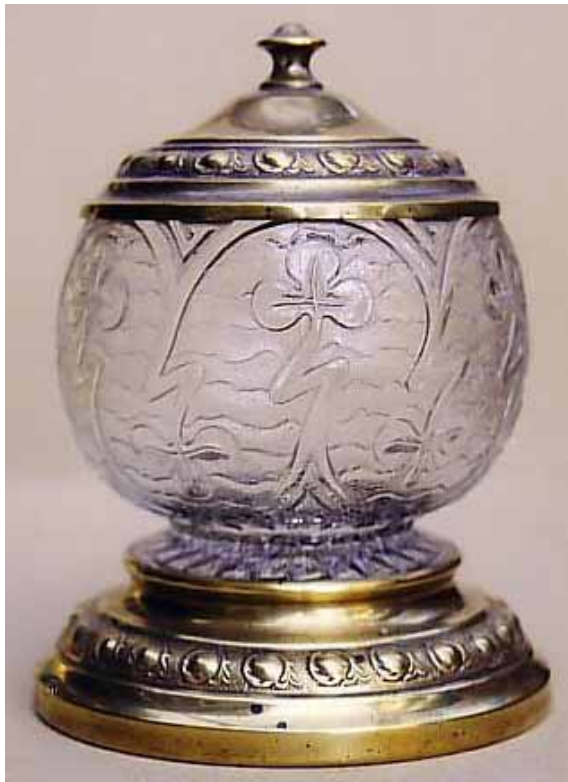
Abb. 2004-1/243 Dose mit Kleeblättern, Metall-Deckel u. -Boden farbl., press-geblasenes Glas, Glas H 15,5 cm, D 9,0 cm Sammlung Zeh Hersteller unbekannt