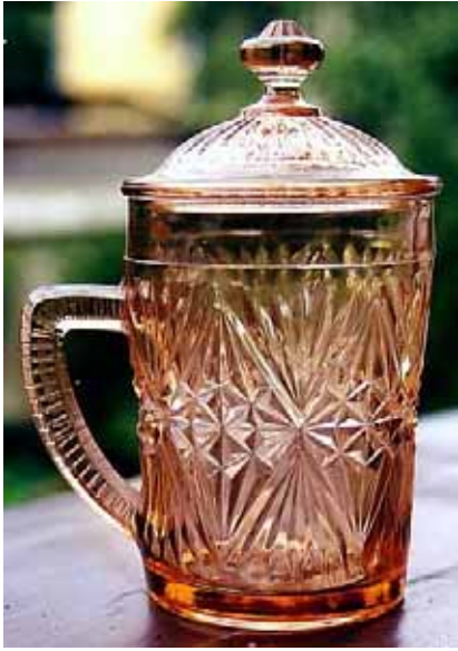
Abb. 2004-1/242 Becher mit Henkel und Deckel, Pseudoschliff-Dekor rosé-farbenes Pressglas, H 16,5 cm, D 8,5 cm Sammlung Zeh Hersteller unbekannt