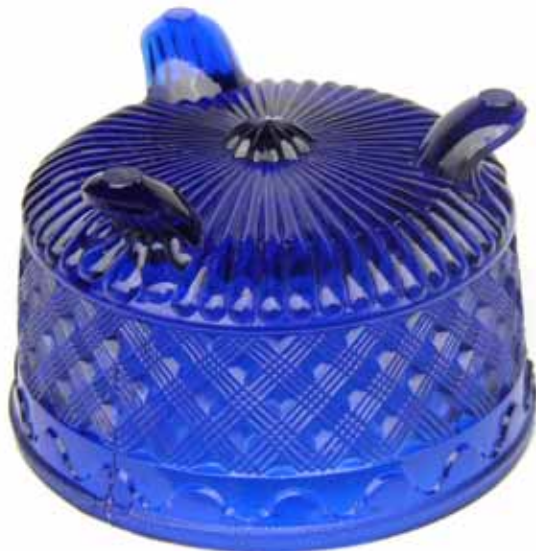
Abb. 2003-4/290 Deckeldose m. Flecht-Dekor, hellblaues Pressglas Auktion eBay Juli 2003 s. MB Meisenthal 1927, Tafel 81, Dose „Renaissance“