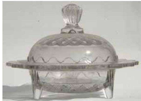
Abb. 2003-4/289 Deckeldose m. Flecht-Dekor gekreuzte Bänder aus 3 Rillen, abgestufte Bögen am Rand farbloses Pressglas H Dose 4,6 cm, H Deckel 7,5 cm, D 11,5 / 16,6 cm Sammlung Geiselberger PG-539 vgl. MB Meisenthal 1927, Tafel 81, Dose „Renaissance“