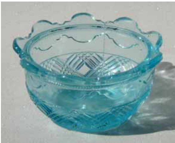
Abb. 2004-2/092 Salzschildchen mit Flecht-Dekor gekreuzte Bänder aus 3 Rillen, abgestufte Bögen am Rand hellblaues Pressglas, H 3,5 cm, D 6,7 cm Sammlung Geiselberger PG-757 vgl. MB Meisenthal 1927, Tafel 81, Dose „Renaissance“

Das Flecht-Muster und der Knauf des Deckels einer Butterdose mit angeformtem Teller stimmen vollständig mit der kobalt-blauen Dose überein. Beide Gläser weisen auch das Muster mit abgestuften Bögen auf. Beim angeformten Rand der Butterdose wird klar, woher dieses Motiv kam: es ist den geschliffenen, gezänkelten Rändern böhmischer Gläser aus dem Biedermeier sehr ähnlich! Boden und Füße der beiden Gläser unterscheiden sich deutlich, auch wenn bei der Butterdose das spirale Flecht-Dekor wieder erscheint. Ich vermute, dass die Butterdose älter als die Zuckerdose ist und dass beide Gläser Relikte eines älteren Services sind, zu dem auch das Salzschildchen gehörte. Beide entsprechen der Zuckerdose „Renaissance“ aus dem Musterbuch Meisenthal 1927, Tafel 81, Sucriérs, nicht vollständig!