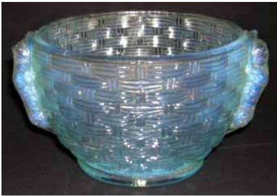
Abb. 2004-3/084 Deckeldose mit Katze und zwei Hunden auf einem Korb farblos., opalisierendes Glas, H ohne Deckel 7 cm, D 11 cm Sammlung Geiselberger PG-810 Hersteller unbekannt, um 1900

Das opalisierende Pressglas erschwert eine zeitliche Bestimmung, weil es einerseits - wie der Verkäufer vermutete - nach Lalique eine typische Glasfarbe der 1930-er Jahre war, andererseits als „Anlauffarbe“ schon lange vor 1900 von vielen Glashütten gemacht wurde. Meisenthal hat in einem Musterbuch, das wahrscheinlich um 1882 (?) herausgegeben wurde, eine Deckeldose mit Katze und Hunden auf einem Korb angeboten. Die hier dargestellte Deckeldose Korb mit Katze und Hunden könnte also auch von Meisenthal kommen, vielleicht sogar das noch unbeholfene Urbild der Dose sein. Die Tiere klammern sich eng angeschmiegt an den Korb, während sie bei allen anderen Varianten sich deutlich vom Korb bzw. Gefäß abspreizen.