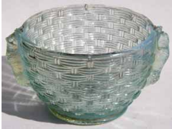
Abb. 2004-3/087 Deckeldose mit Katze und zwei Hunden auf einem Korb farbloses Glas, H 7 cm, D 11 cm (Deckel fehlt) Sammlung Geiselberger PG-810 Hersteller unbekannt, um 1900

Die bläuliche Anlauffarbe war wieder einmal kaum zu fotografieren. Am besten ging es noch von der Unterseite. So deutlich wie auf dem Bild in eBay habe ich sie nicht herausbringen können.