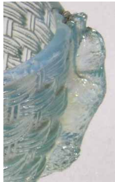
Abb. 2004-3/086 Deckeldose mit Katze und zwei Hunden auf einem Korb farbloses Glas, H 10,7 cm, D 12 cm Sammlung Fehr Hersteller unbekannt, um 1900