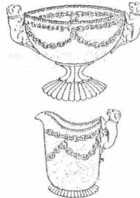
Abb. 2002-5/136 Deckeldose Nr. 26 mit Katze und zwei Hunden als Griff Milchkännchen Nr. 26 mit Katze als Henkel Musterbuch eines englischen Großhändlers, um 1885 aus Crowshaw, Davidson 1878-1888