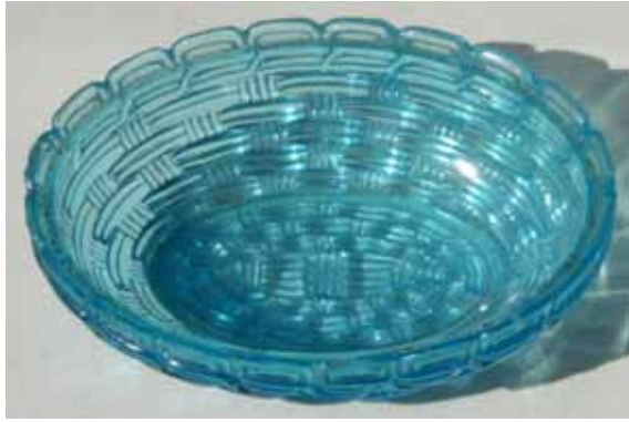
Abb. 2004-4/018 Deckeldose Henne auf Korb Henne farbloses Glas, H Kopf 7,2 cm, H Schwanz 5,7 cm, B 9,8 cm, L 13,3 cm Korb blaues Glas, H 4,2 cm, B 10,8 cm, L 14,3 cm Henne 2 Formnähte, Korb 4 Formnähte, kaum sichtbar Sammlung Chiarenza vgl. Sammlung Vivian Moore, „Griffon Head“ Hen on Nest aus Website Shirley Smith, http://www.gransplace.com/hens.htm ... Maker Unknown, Figure 95 keine Marke s. Preis-Courant S. Reich & Co. Mai 1873, Tafel 28 Nr. 3041, Deckeldose Henne auf Korb