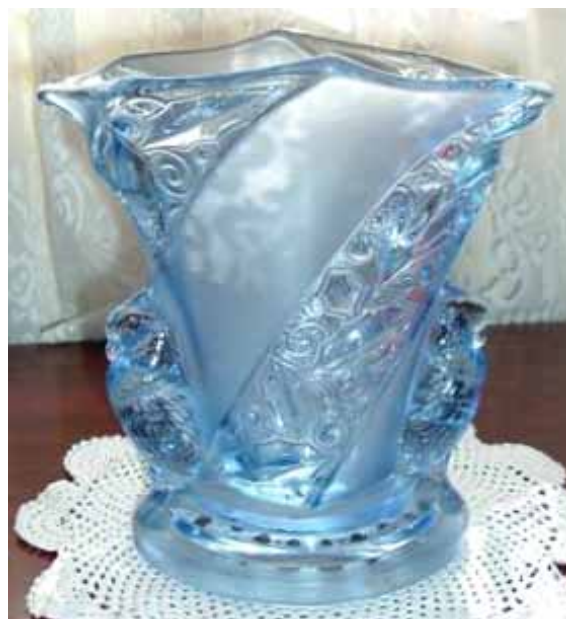
Abb. 2004-3/289 a/b Vase mit zwei Papageien (?), schräge Bänder mit Blättern blaues, teilweise mattiertes Pressglas H xxx cm, B xxx cm, L xxx cm Sammlung Heinemann s. MB Brockwitz 1941, Tafel 59, Blumenvase Nr. 6925 Schnabel des Vogels deuten auf einen Kakadu hin (Plissolophus), eine Unterfamilie der Familie der Papageien (Psittacornithes), Vorkommen in Australien, Neuguinea, Philippinen und auf Südsee-Inseln [s. Brehms Tierleben, Leipzig / Wien 1893, Band 3, Vögel, S. 381 ff. u. S. 409 ff.]

Die blaue Vase mit den Kakadus entstand zwischen 1932 und 1941 bei Brockwitz. In den Musterbücher bis 1931 taucht sie noch nicht auf. Musterbücher von 1932 bis 1940 fehlen bisher. Nach 1941 produzierte Brockwitz nur noch militärische Ausrüstung. Sie ist wahrscheinlich in Konkurrenz zu tschechischen Vasen mit Vögeln entstanden. Brockwitz exportierte auch nach England, aber sicher nicht mehr nach 1939. Wann und wie kam also die blaue Vase nach England? Von England wurde sie dann 2004 nach Australien verkauft. (Auch die rosa Vase Sammlung Blomfield gelangte schließlich bis Australien)