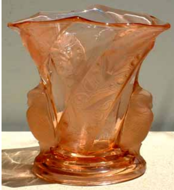
Abb. 2005-1/348 a/b Vase mit zwei Kakadus, schräge Bänder mit Blättern rosa-farbenes, teilweise mattiertes Pressglas H xxx cm, B xxx cm, L xxx cm auf der Unterseite eingezätzte Aufschrift „DEUTSCHLAND“ (Rest nicht mehr lesbar; zur besseren Lesbarkeit schwarz hinterlegt!) Sammlung Blomfield s. MB Brockwitz 1941, Tafel 59, Blumenvase Nr. 6925