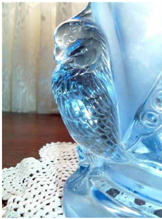
Abb. 2000-3/255 Musterbuch Brockwitz 1941, Tafel 59, Blumenvasen aus Sammlung Weinberger