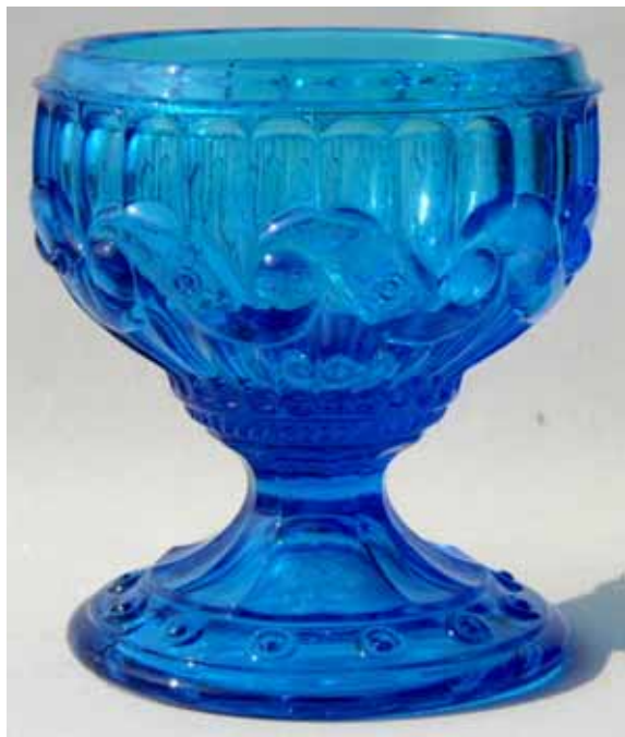
Abb. 2004-1-12/003 Zuckerdose m. Pseudo-Facetten und geschwungenen Walzen, gepresst, H 12 cm MB Stölzle Nr. 142, Tafel 23, Nr. 2299 s. Abb. 2004-1-12/002, Sammlung Südböhm. Museum České Budějovice, Inv.Nr. UP 2574