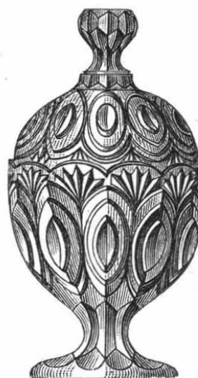
2176 · 10 1 / 2 cm