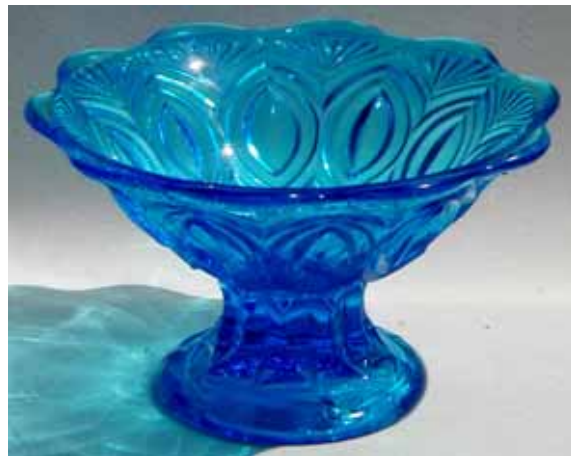
Abb. 2004-1-12/013 Zuckerdose m. Pseudo-Facetten, gepresst, H 10,5 cm MB Stölzle Nr. 142, Tafel 23, Nr. 2176