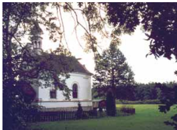
Abb. 2002-4/042 Kirchlein an der Landstraße b. Jiříkovo Údolí / Georgenthal, August 2002