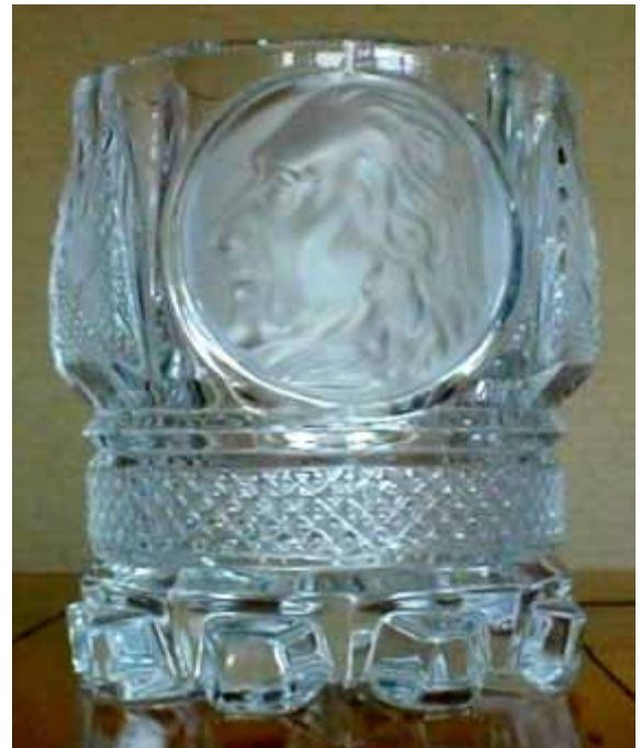
Abb. 2005-1/444 a/b Fußbecher mit Relief-Portrait Liszt farbloses Pressglas, H 11,0 cm, D ca. 9,5 cm spez. Gewicht 3,00 g/ccm im Boden unten eingepresste Marke „Krone m. 3 Zacken u. aufrechter Bär, nach links gehend“ blaues Klebeetikett „BERLIN DESIGN“ u. Marke „Bär“ eingezählte Nummer „Nr. 2343“ (von 3000) „Berlin Design“ und Peill + Putzler, Düren, um 1976