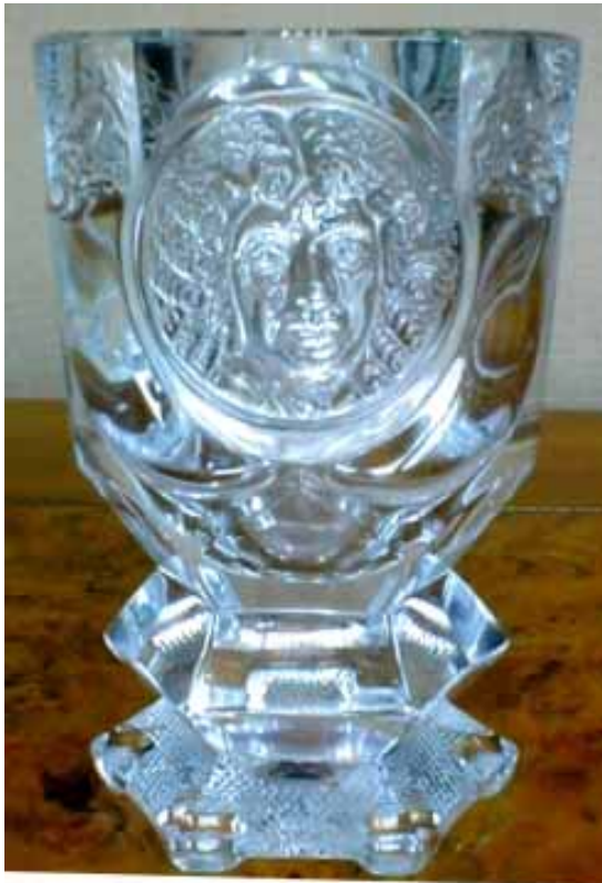
Abb. 2003-1/216 (neu) Fußbecher mit Relief-Portrait Molière farbloses Pressglas, H 12,7, D oben 7,1 / 8,5 cm spez. Gewicht 3,00 g/ccm im Boden unten eingepresste Marke „Krone m. 3 Zacken u. aufrechter Bär, nach links gehend“ „Berlin Design“ und Peill + Putzler, Düren, um 1976

Hier ein Ausschnitt aus meinem Briefverkehr mit der Firma „Berlin Design“: