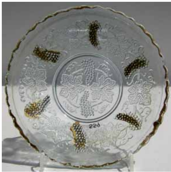
Abb. 2005-2/374 Teller mit Weintrauben, -ranken und blättern farbloses Pressglas, D 14,5 cm, tlw. Goldbrunze Sammlung Geiselberger PG-559 vgl. MB SG Radeberg vor 1897, Tafel 20, Teller Nr. 142