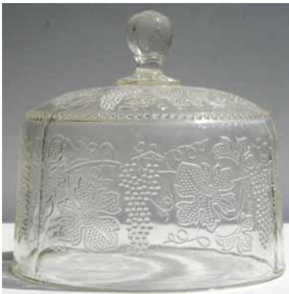
Abb. 2005-2/371 Käseglocke mit Weintrauben, -ranken und blättern farbloses Pressglas, H 12,1 cm, D 14,1 cm Sammlung Geiselberger PG-566 s. MB Boehringer 1928, Tafel 4, Diverses s. MB Boehringer 1930, Tafel 4, Diverses [PK 2004-1: Hersteller unbekannt, vermutlich Brockwitz, Fenne oder Walther] vgl. MB SG Radeberg vor 1897, Tafel 23, Butterdosen, Käseglocken, Nr. 166

Abb. 2004-3-2/006 Käseglocke mit Weintrauben, -ranken und blättern farbloses Pressglas, H 12,5 cm, D 13,4 cm Sammlung Geiselberger PG-365 s. MB Boehringer 1928, Tafel 4, Diverses s. MB Boehringer 1930, Tafel 4, Diverses [PK 2004-1: Hersteller unbekannt, vermutlich Brockwitz, Fenne oder Walther] vgl. MB SG Radeberg vor 1897, Tafel 23, Butterdosen, Käseglocken, Nr. 166