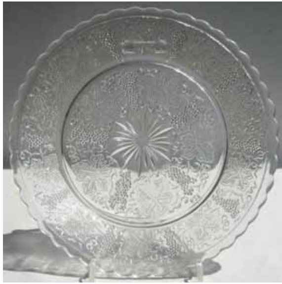
Abb. 2005-2/374 Teller mit Weintrauben, -ranken und blättern farbloses Pressglas, D 14,5 cm, tlw. Goldbrunze Sammlung Geiselberger PG-559 vgl. MB SG Radeberg vor 1897, Tafel 20, Teller Nr. 142