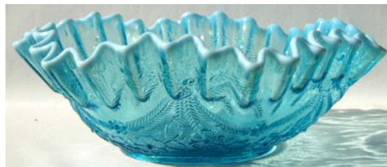
Abb. 2005-2/402 Schale mit Blüten, Blättern und Feder-Girlanden, Rand gekniffen und gefaltet, Boden mit Blumen- und Rosen-Motiv blaues Pressglas, Rand mit opak-weißer Anlauffarbe H ca. 8 cm, D ca. 24 cm Sammlung Geiselberger PG-900 Hersteller unbekannt, Deutschland (?), um 1930 (?)

Es könnte sich wie bei ähnlichen Tellern oder Schalen, z.B. Fenne, Dekor „Ewald“, um Motive aus der „Volkskunst“ handeln, die durch und nach dem Jugendstil populär wurden. Das würde eine Zeit um 1930 ergeben. Um 1929 war durch die Weltwirtschaftskrise ein Einschnitt entstanden. Das Muster könnte danach aufgetaucht sein. Dem widerspricht allerdings, dass das Muster „Ewald“ bereits in MB Fenne 1903-09, Tafel 110, Nr. 1136, „Teller gelippt“, enthalten war.