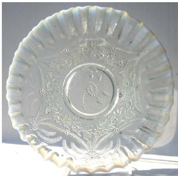
Abb. 2003-3/089 u. Abb. 2003-3/090 Teller mit Blüten, Blättern und Feder-Girlanden Rand gekniffen, Boden mit Blumen- und Rosen-Motiv farbl. Pressglas, Rand m. Anlauffarbe, H 3,5 cm, D 22,5 cm Sammlung Geiselberger PG-616, ehem. Sammlung Lenek Hersteller unbekannt, Deutschland (?), um 1930 (?)

Der farblose Teller mit opak-weißer Anlauffarbe am Rand stammt aus der Sammlung Lenek. Die Blüten und Blätter sind mit Punkten gefüllt, ein Detail, das oft vorkommt, aber nicht in der Kombination mit feinen Feder-Girlanden (oder Palmblättern) und dem im Bodenring eingepressten Blumenstrauß mit einer Ringelblume (?) und mit Rosenknospen.