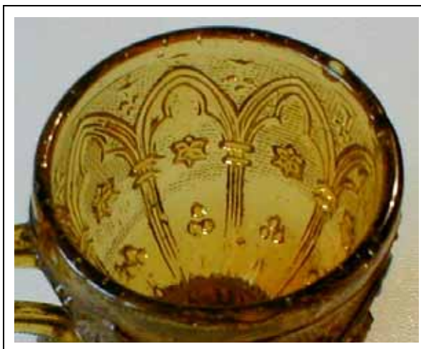
Abb. 2002-4/293 Becher m. „arcades gothiques“ u. „sabl. arcades gothiques“ MB LH 1840, Planche 12, Nr. 1057, Baccarat, u. MB LH 1841, Planche 87, Nr. 2667, Baccarat