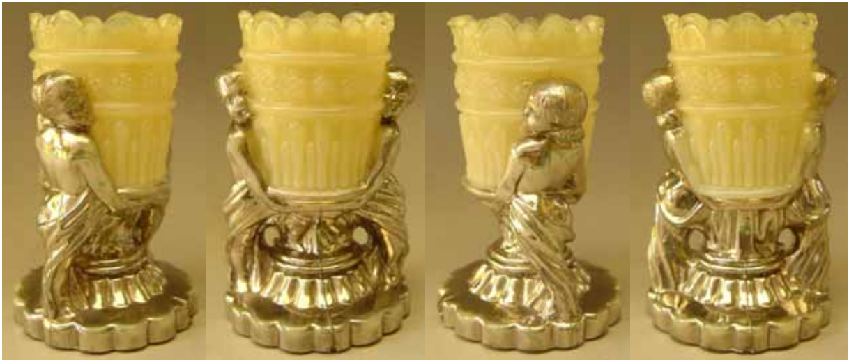
Abb. 2005-3/214 Streichholzbehälter Vase von zwei Kindern getragen opak-hell-braunes, opalisierendes Glas, Unterteil mit Verchromung, H 10,4 cm, D 6,5 cm Sammlung Christoph, ohne Marke, Hersteller unbekannt, Frankreich, um 1900