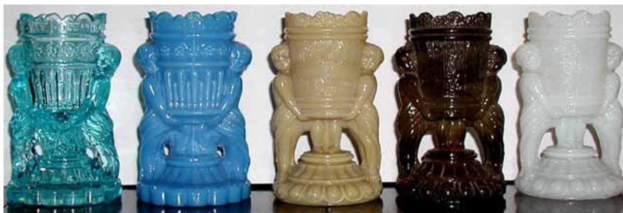
Abb. 2004-3/060 Streichholzbehälter Vase von zwei Kindern getragen, hellblaues u. opak-blaues Pressglas, H 10,5 cm, D unten 6,5 cm, ohne Marke opak-hellbraunes, opak-dunkelbraunes, opak-weißes Pressglas, H 10,5 cm, D unten 6,3 cm, mit Marke „SV“ , Sammlung Fehr s.a. Chiarenza, Milk Glass Book, 1998, S. 155, Nr. 369, opalisierend opak-weißes Pressglas, mit Marke „SV“ Hersteller unbekannt, mit und ohne Marke „SV“, Frankreich, um 1900