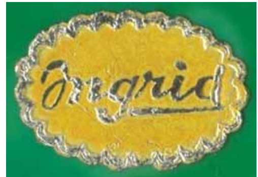
Abb. 2005-3/328 Flakon und Stöpsel mit Ranken-Dekor opak-jadegrünes Pressglas, H xxx cm, B xxx cm Sammlung Lorenz Klebeetikett „INGRID“ Klebeetikett „MADE IN CZECHOSLOVAKIA“ auf der Unterseite s. MB Glassexport Jablonec glass, um 1952, Tafel 31, Toilettenset, Nr. 30345

Wie lange existierten die Tschechischen Glasbetriebe eigentlich als privates Unternehmen?