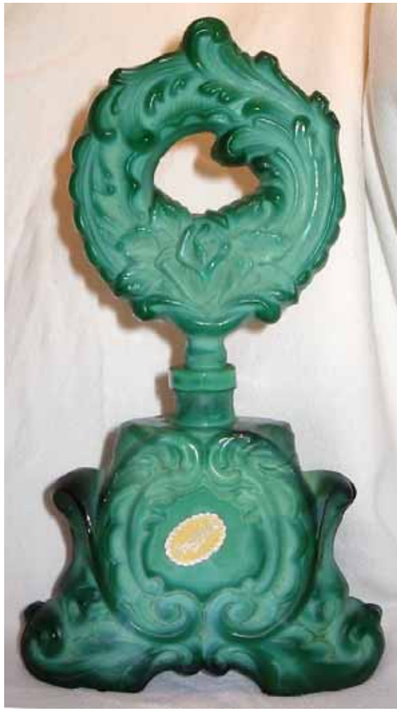
Abb. 2005-3/327 Flakon und Stöpsel mit Ranken-Dekor opak-jadegrünes Pressglas, H xxx cm, B xxx cm Sammlung Lorenz Klebeetikett „INGRID“ Klebeetikett „MADE IN CZECHOSLOVAKIA“ auf der Unterseite s. MB Glassexport Jablonec glass, um 1952, Tafel 31, Toilettenset, Nr. 30345

Außerdem ist noch ein Foto von einem Flakon aus Malachitglas beigelegt, den ich neu erworben habe. Er ist sehr interessant und könnte Verwirrung stiften. Der Flakon trägt sowohl die originale Marke „INGRID“ als Etikett auf der Frontseite, als auch die Aufschrift „MADE IN CZECHOSLOVAKIA“ als Etikett auf der Unterseite.