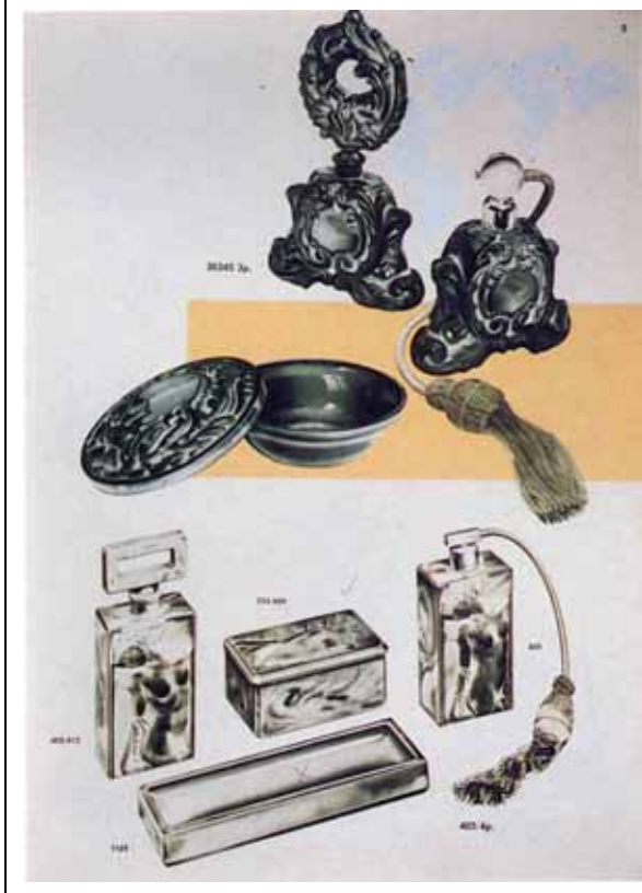
Abb. 2003-4-06/005 MB GLASSEXPOR „Ingrid“ um 1960, Tafel 5

Zur Verwirrung trägt tatsächlich bei, dass auf der Frontseite ein Etikett „INGRID“ und auf der Unterseite ein