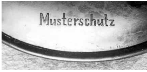
Abb. 2002-1/171 Vase mit Eichenblättern und Mäander opak-schwarzes Pressglas, L / B 16,5 cm, B 5 cm, H 8,4 cm Unterseite ohne Inschrift wurde aber auch mit „Musterschutz“ gesehen Sammlung Stopfer Hersteller unbekannt