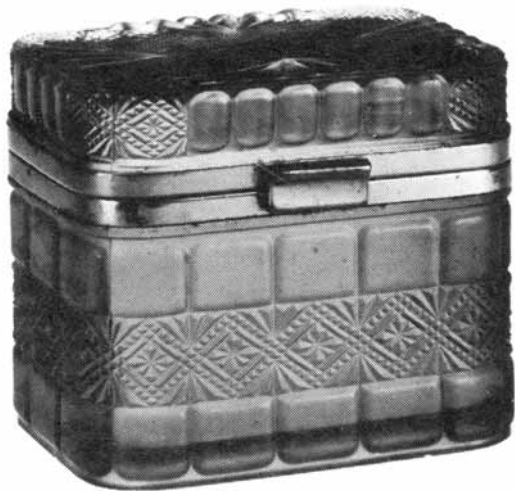
Abb. 2002-1/173 (s.a. Abb. 2002-1/174) Zuckerbox mit Pseudoschliff farbloses, mattiert. Pressglas, L 12 cm, B 8,7 cm, H 9,9 cm Unterseite mit Rundmarke und russischer Inschrift „1903“ Sammlung Stopfer Hersteller unbekannt vgl. Spillman 1981, Abb. Nr. 1533