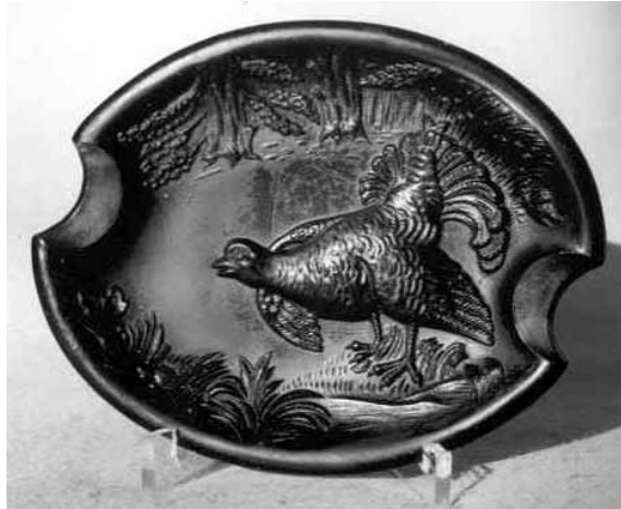
Abb. 2002-1/167, Abb. 2002-1/168 und Abb. 2002-1/169 Aschenschale mit Auerhahn opak-schwarzes Pressglas (Hyalith), L 15,3 cm, B 12 cm, H 1,5 cm Unterseite mit russischer Inschrift und „1913“ und mit deutscher Inschrift „Musterschutz“ Sammlung Stopfer Hersteller unbekannt