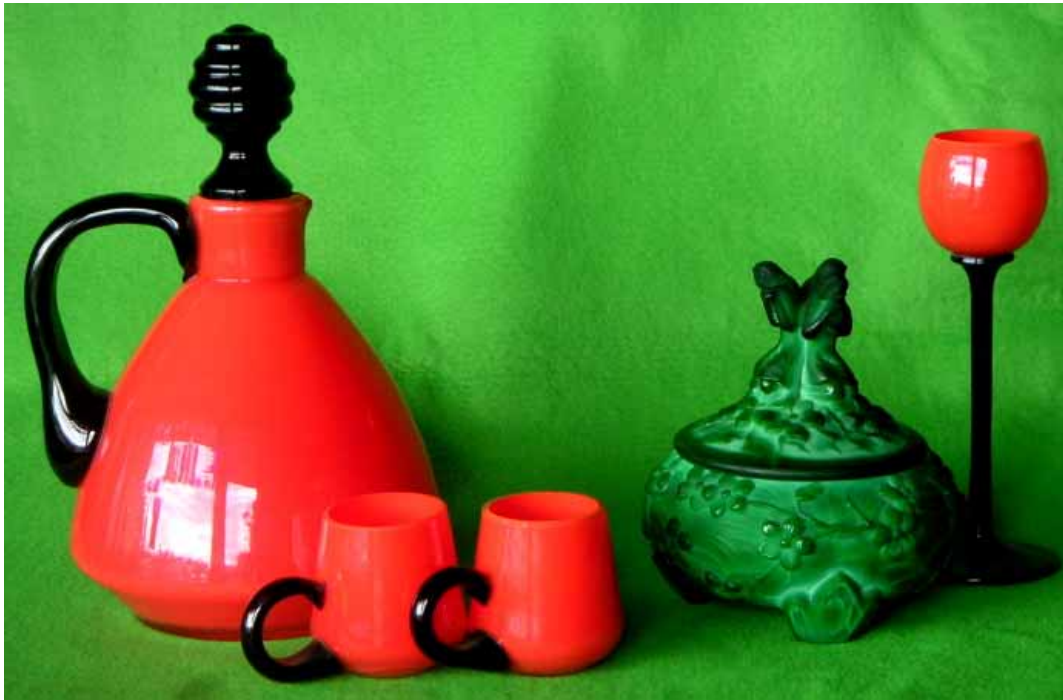
Abb. 2005-2/434 Ausstellung „Gläser sammeln - eine Leidenschaft“, Museum Dreieich, Plakat und Einladungskarte Sammlung Eickmann