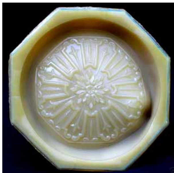
Abb. 2006-1-17/020 (Ausschnitt)

MB Vierzon 1889 Moulure a la presse, Planche 207, Bougeois Sammlung Neumann