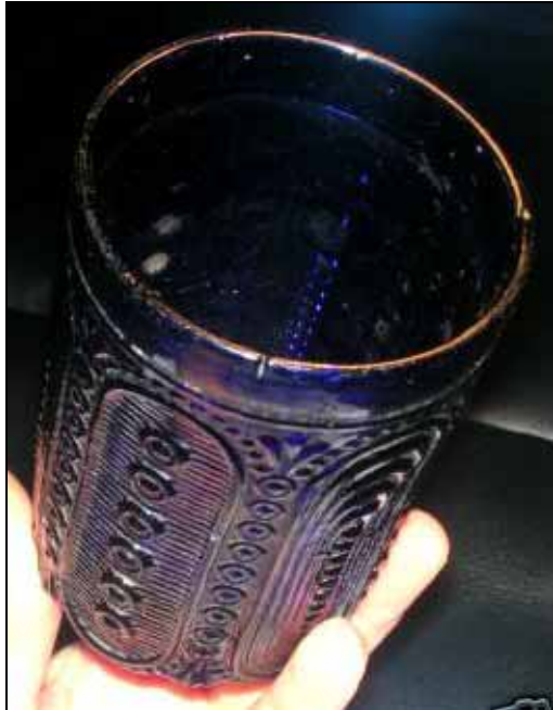
Abb. 2006-1/xxx eBay Österreich, Art.Nr. 7374691797, Aufruf €90, €99,00 "Biedermeierglas in Kobaltblau um 1840. Kobaltblaues, form-geblasenes Glas mit Formnähten, H 11 cm, B 7 cm - Freudenthal um 1840, Oberösterreich " SG: Hersteller unbekannt, Böhmen oder Steiermark, um 1850

Aber bisher werden Gläser mit diesen Mustern von den Glashistorikern der Sammlung des Joanneums in Graz vor allem den Glashütten in der „Südsteiermark“, heute Slowenien, zugeschrieben!