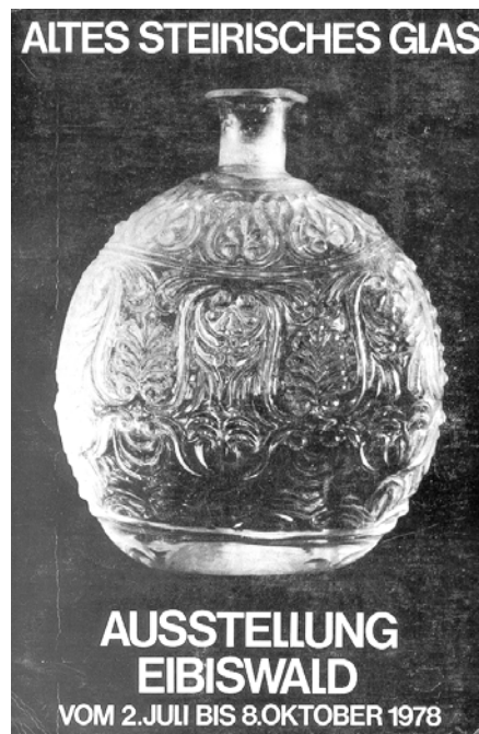
Abb. 2000-5/173 Schnapsflasche, sog. „Tschuttera“ mit „Reliefverzierung“ farbloses, form-geblasenes Glas, H 19 cm aus Eibiswald 1978, Abb. 72, Abb. auf dem Einband Glashütte Staritsch / Ferdinandsthal, Steiermark, um 1820

Dass die Glashütte Freudenthal aber die ihr zugeschriebenen form-geblasenen Gläser hergestellt hat, ist zweifelhaft! Nicht, weil die Glasmacher in Freudenthal das nicht gekonnt hätten!