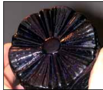
Abb. 2000-5/175 Schnapsflasche, sog. „Tschuttera“ mit „Reliefverzierung“ farbloses, form-geblasenes Glas, H 19,5 cm aus Eibiswald 1978, Abb. 73 Glashütte Staritsch / Ferdinandsthal, Steiermark, um 1820