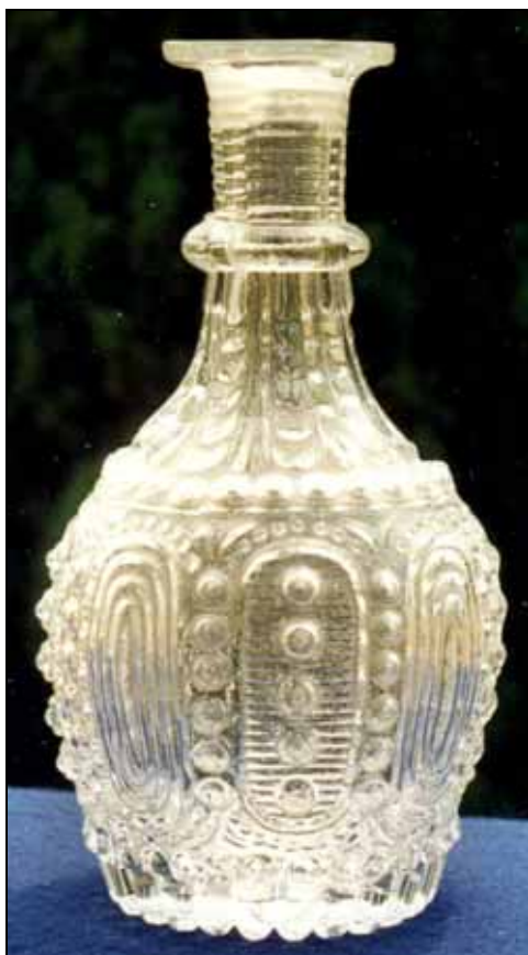
Abb. 2002-5/103 Flasche / Karaffe ineinander liegende Ovale, Perlen und waagrechte Riffelung farbloses, form-geblasenes Glas, H 19 cm, D max 9,7 cm Form 3-tlg., Boden strahlig gekerbt Sammlung Stopfer Glashütte Staritsch-Ferdinandsthal, Steiermark, um 1850