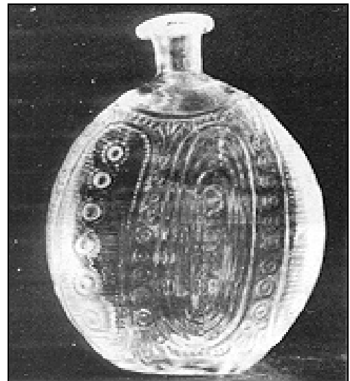
Abb. 2002-5/100 Flache Flasche „Tschuttera“ ineinander liegende Ovale, Perlen und waagrechte Riffelung grünliches, form-geblasenes Glas, H 13 cm, B 10 cm Form 3-tlg., angesetzter Hals Sammlung Stopfer Glashütte Staritsch-Ferdinandsthal, Steiermark, um 1850 vgl. Eibiswald 1978, Abb. 73 u. 74, gleiches Muster

Abb. 2000-5/175 Schnapsflasche, sog. „Tschuttera“ mit „Reliefverzierung“ farbloses, form-geblasenes Glas, H 19,5 cm aus Eibiswald 1978, Abb. 73 Glashütte Staritsch / Ferdinandsthal, Steiermark, um 1820