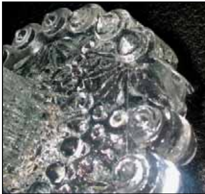
Abb. 2000-5/198 Zuckerschale dunkel-blaues, form-geblasenes Glas, H 13,2 cm aus Adlerová 1995, S. 5, „pressgeblasen“ Böhmen oder Mähren, nach 1850 Sammlung Kunstgewerbemuseum Prag