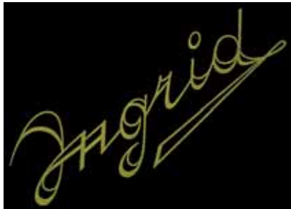
Abb. 2006-1/242 Originale Form der Marke „Ingrid“ wie sie vom Unternehmen Curt Schlevogt verwendet wurde

Einleitung, in der alle geschichtlichen Verbindungen erklärt wurden und den ursprünglichen Herstellern Raum gegeben wurde. Der Start der Kollektion „Desná“ wurde nach einigen anfänglichen Missverständnissen von den Großhändlern und Händlern sehr gut aufgenommen.