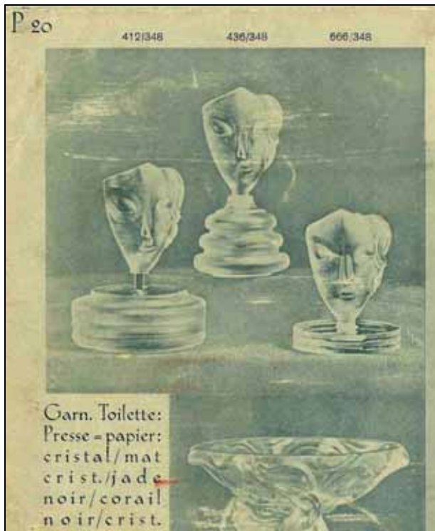
Abb. 2006-1/243 originale Artikel Katalog „Ingrid“ Firma Curt Schlevogt, Gablonz a.d.N., 1930-er Jahre