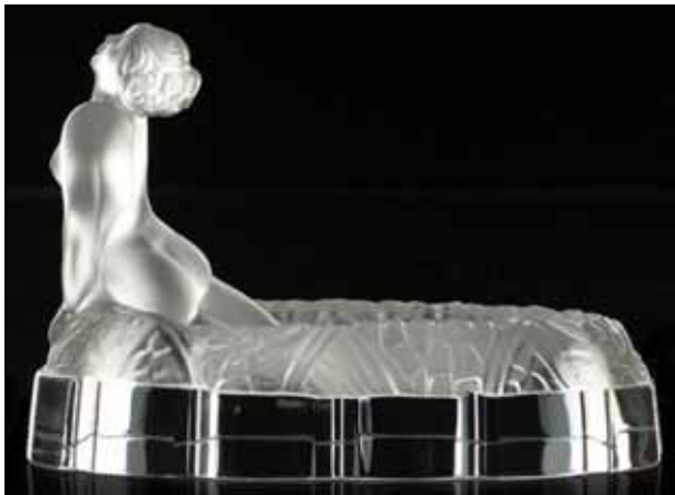
Abb. 2006-1/245 Schale „Susanne im Bade“ Curt / Henry G. Schlevogt, Gablonz a.d.N., 1930-er Jahre Reproduktion Kollektion „Desná“, um 2005

Wie die Gerichte die Situation sehen werden, ist noch nicht zu erkennen, da der Streit um das „Copyright“ kompliziert ist und die tschechischen Erfahrungen auf diesem Gebiet bis heute noch gering sind. Wie auch immer das Ergebnis sein wird, den bereits angerichteten Schaden können wir nicht mehr ungeschehen machen.