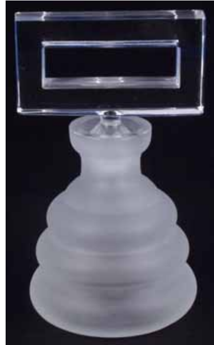
Abb. 2006-1/244 Artikel des Unternehmens JaS, Jablonec nad Nisou, um 2005 eine Zusammenstellung in niedriger Qualität