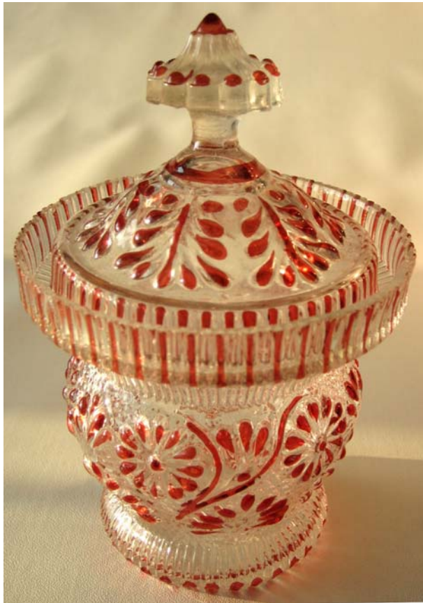
Abb. 2006-1/116 Deckeldose mit Blättern und Blüten form-geblasenes, farbloses Glas, teilweise rot lasiert, H 14,5 cm, D 9,4 cm Sammlung Vogt Hersteller unbekannt, Böhmen?, Steiermark?, um 1850?