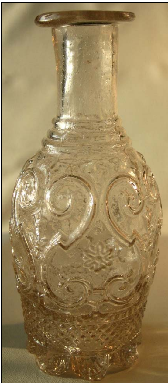
Abb. 2006-1/111 Kleine Karaffe mit Ranken und Blüten, Abriss form-geblasenes, farbloses Glas, H 16,5 cm, D 7,5 cm Sammlung Vogt vgl. MB Portieux 1894, Planche 219, Articles divers, Narguilés [Wasserpfeifen], Carabasses, Nr. 4175