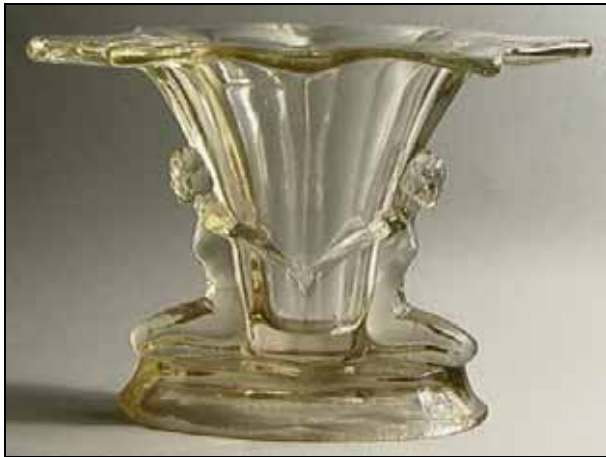
Abb. 2006-2/092 Vase mit zwei Frauen farbloses, nicht mattiertes Pressglas, H xxx cm, B / L xxx cm ehemals A. Walther & Söhne, Ottendorf-Okrilla, s. MB Walther 1934, Tafel 86, Vasen, Nr. 44013, Vase Windsor Hersteller unbekannt, angeblich Gebrüder Bowling, Lorraine / Frankreich