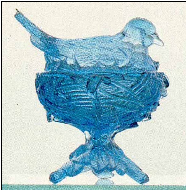
Abb. 1999-2/156 und Abb. 1999-2/162 Deckeldose „Tauben auf dem Nest“ opak-grünes Pressglas aus Reidel 1988, S. 111, 4. Reihe 1. Glas blaues Pressglas aus Reidel 1988, S. 105, 2. Reihe 2. Glas

Chiarenza: „Einer der frühen Berichte über das „Rotkehlchen [Robin] auf dem Nest“ erscheint in Ruth Webb Lee’s „Victorian Glass“ (herausgegeben 1944), wo es auf Seite 116 zusammen mit dem selben Rotkehlchen auf einem runden, geflochtenen Korb gezeigt wird. Lee stellt fest, das diese und andere Deckeldosen mit Tieren in Vallérysthal „um 1936 und bis 1939“ gefertigt wurden. „Einige von ihnen“ - so fährt sie fort - „haben geprägte Marken „VALLERYSTHAL“ in den Böden der Dosen, andere sind ohne Marke. Der Vogel auf Seite 116 ist aus blau-opakem Glas und gemarkt. Ich habe ihn in einem Geschenke-Laden gekauft.“ [Lee 1944, S. 324]