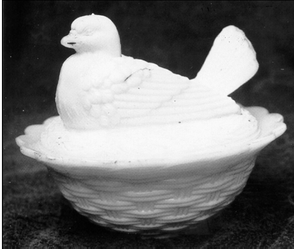
Abb. 2001-1/419 (Ausschnitt) MB Gebrüder von Streit 1913, Tafel 14, Verschiedene Dosen (hellweiß, milchweiß u. türkisblau), Nr. 1287, „Taubendose“

Abb. 1999-2/163 Deckeldose „Fächertaube auf dem Korb“ opak-weißes Pressglas, L 12,7 cm „Hersteller und Zeit unbekannt“ aus Chiarenza 1998, S. 73, Abb. 143 SG: Auch dieser Vogel ist deutlich als Taube erkennbar und wird von Chiarenza auch Taube genannt, möglicherweise ist damit aber das a.a.O. „Rotkehlchen auf dem geflochtenen Korb“ gemeint. s. MB Streit 1913, Tafel 14, Nr. 1287, „Taubendose“