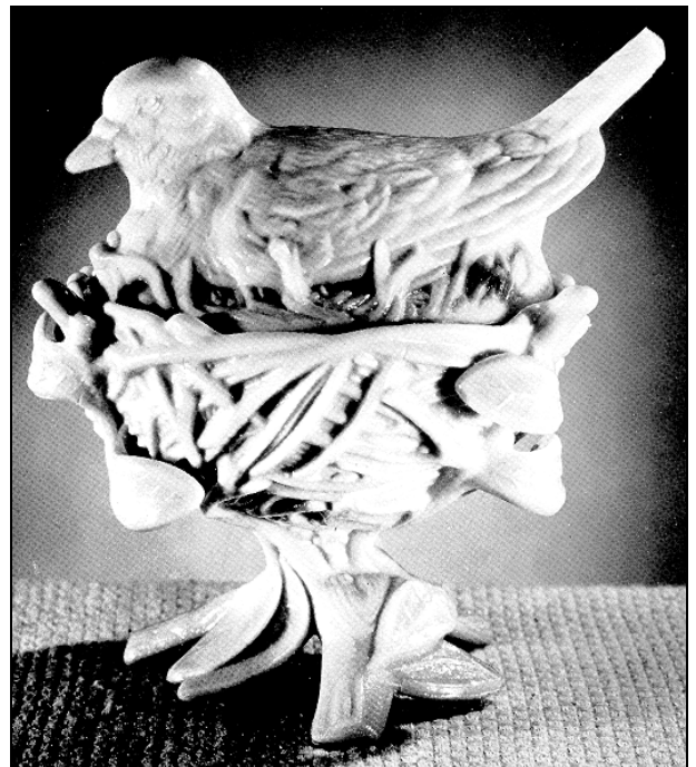
Abb. 1999-2/164 „Robin on Pedestal Base, blau-opakes Glas; die Original-Version dieses schönen Milchglas-Stückes wurde in Vallérysthal nur als weiß-opakes Glas geschaffen. Die ebenso gut aussehende Reproduktion aus Westmoreland gibt es in blau- oder weiß-opakem Glas“ aus Belknap 1949, Abb. 267 SG: Eine der frühesten Abbildungen der „Tauben auf dem Nest“ stammt von E. McCamly Belknap, Milk Glass, 1949. Der Vogel ist als Taube deutlich zu erkennen, wenn er auch etwas verhandelt wurde. Ein Rotkehlchen wäre das jedenfalls nicht mehr geworden!

SG: Bei den Sammlern in den USA hat sich für die Deckeldose „Tauben auf dem Nest“ aus Portieux die Bezeichnung „Robin on Pedestal Base“ eingenistet. Es ist aber kein Rotkehlchen! Das Stück dürfte eines der bekanntesten Pressgläser überhaupt sein. Schon E. McCamly Belknap hat es in seinem Buch „Milk Glass“ abgebildet, erstmals erschienen 1949. Weil das Glas so populär war, wurde es selbstverständlich auch kopiert. Die bekannteste Kopie stammt von Westmoreland (siehe Belknap, oben). Selbstverständlich gibt es in den USA auch eine miserable Reproduktion aus Taiwan.