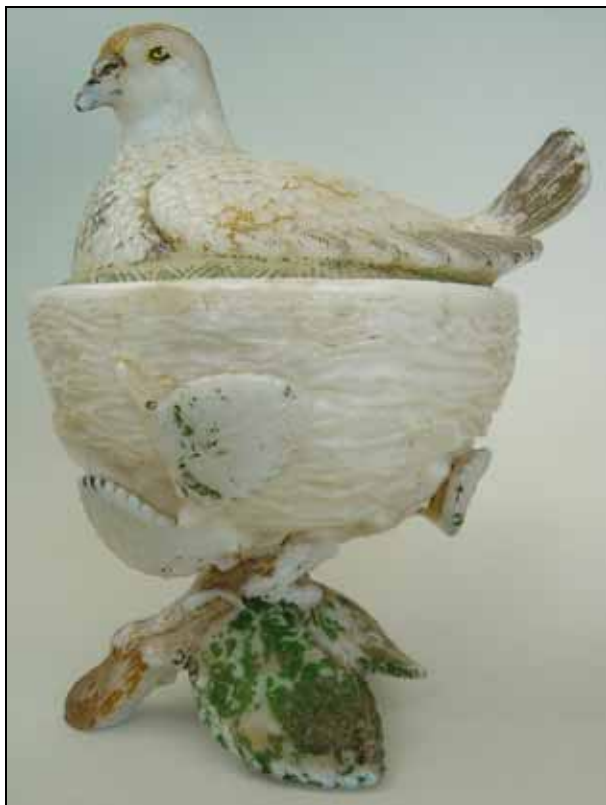
Abb. 2006-3/231 Deckeldose mit einer Taube auf dem Nest opak-weißes Pressglas, bunt bemalt, H xxx cm, D xxx cm Sammlung Christoph ohne Marke s. MB Vallérysthal 1894, Planche 243, Sucriers rebrûlé, No. 3771, Dose Taube auf einem Nest s. MB Vallérysthal 1908, Planche 303, Sucriers rebrûlé No. 3732, Dose Taube auf einem Nest s. MB Portieux 1886, 2. ème Partie, Planche 173, Sucriers No. 3076, Taube auf einem Nest s. MB Portieux 1894, Planche 184, Sucriers divers, No. 3462

Abb. 2006-3/230 Deckeldose mit einer Taube auf dem Nest opak-weißes Pressglas, bunt bemalt, H 16,8 cm, D 11,6 cm Sammlung Christoph im Deckel Marke „SV“ Hersteller unbekannt, Frankreich, um 1900