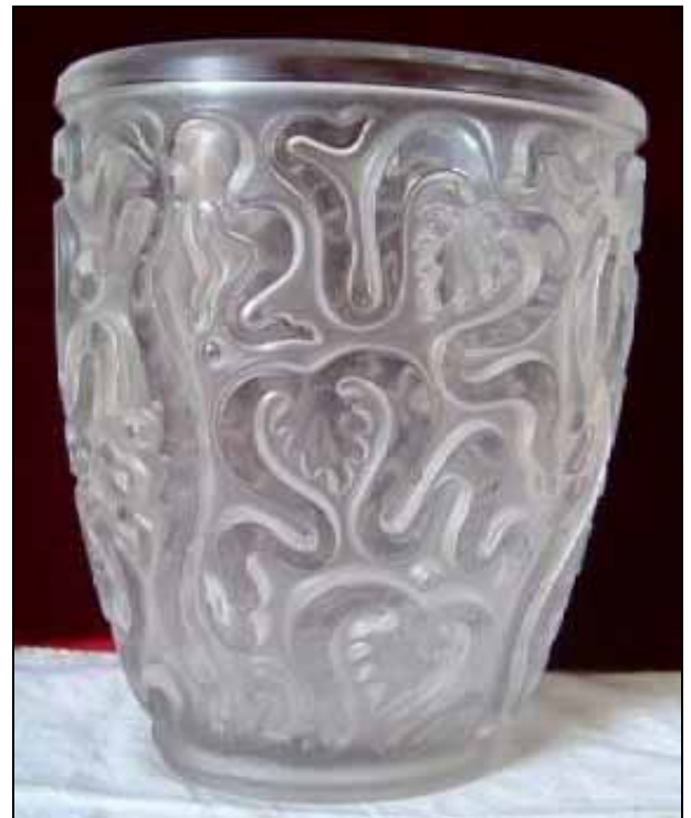
Abb. 2006-2/269 eBay USA, Art.Nr. 7410973012, € ca. 30,00 “Czech WEIL Barolac Frosted Art Deco Crystal Vase ... design is very deep, vase is extremely thick and heavy, oval shaped rim, original paper label affixed which reads „Barolac, Made in Czechoslovakia, Weil, Exclusive Importation“ H ca. 20 cm / 8", D ca. 16,3 cm / 6 1/2" SG: Hersteller unbekannt, Tschechoslowakei? 1930-er Jahre?

Bisher ist mir nicht klar, ob die unten abgebildete Kata- log-Seite tatsächlich von dem US-Glashändler WEIL stammt. Sicher ist aber wegen der Marke „BOHEMIA Crystal“, dass die Seite aus den Jahren ab 1955 stammen muss!