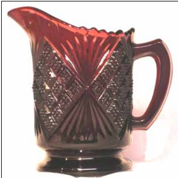
Abb. 2006-4/095 Creamer with diamonds & fans amethyst pressed glass, H 10,2 cm, D 5,7 cm impressed mark „NOTSJÖ“ similar to Davidson, Gateshead, 1896 similar to „Amanda“ from Fenne, 1903