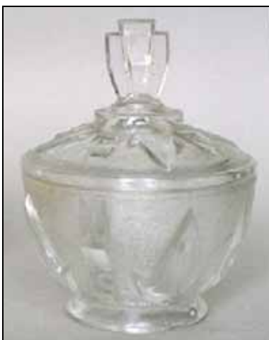
Abb. 2007-1/161 Krater do lodu z pokrywką art deco Polska, I ćw.XX w. Huta Szkła Niemen

Abb. 2007-1/160 Bomboniera art deco Polska, 1.30.XX w. nsygn. [nicht gemarkt], Huta Szkła Hortensja