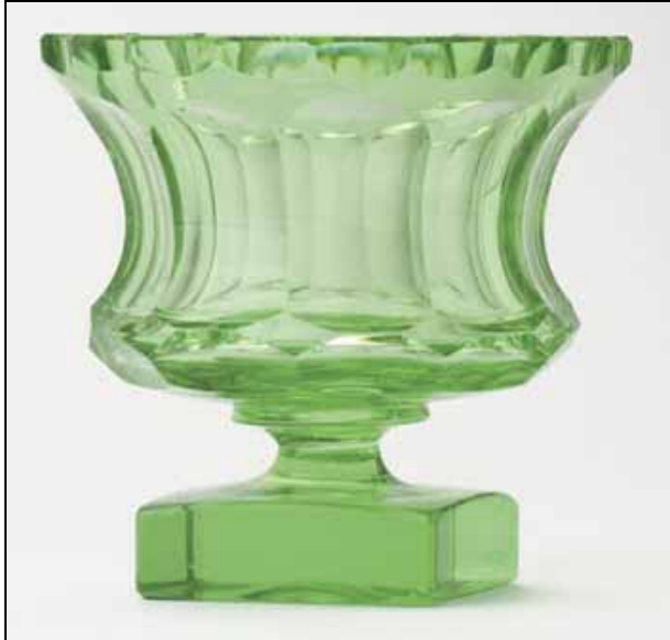
Abb. 2007-1/159 Wazonik, szkło szlifowane [kleine Vase, Glas, geschliffen] Huta Szkła Niemen , model 1047 aus http://www.artbiznes.pl/jsp/artbiznes/artykuly.jsp;...jsessionid=7F94080B02B375FD447E1B0E05A75554?-Typ=detal&Id=1&IdArtykulu=1267

Die folgenden Bilder stammen von den Websites polnischer Auktionshäuser, leider in magerer Qualität, aber interessant!