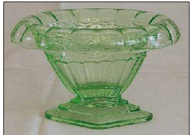
Abb. 2001-05/456 (Ausschnitt) MB Bernsdorf 1932, Tafel 52 a, Nachtrag Diverse Artikel Nr. 797/798, Vase „Rosalind“ mit Einsatz