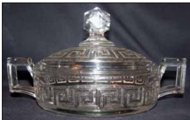
Abb. 2007-2/328 Deckeldose mit Mäander-Muster und zwei Henkeln farbloses Pressglas, H 11 cm, D 14,5 cm (ohne Henkel) Sammlung Rühl & Sadler in Deckel und Boden gemarkt mit „ H in einer Raute “ A. H. Heisey Glass Company, Newark, Ohio, USA