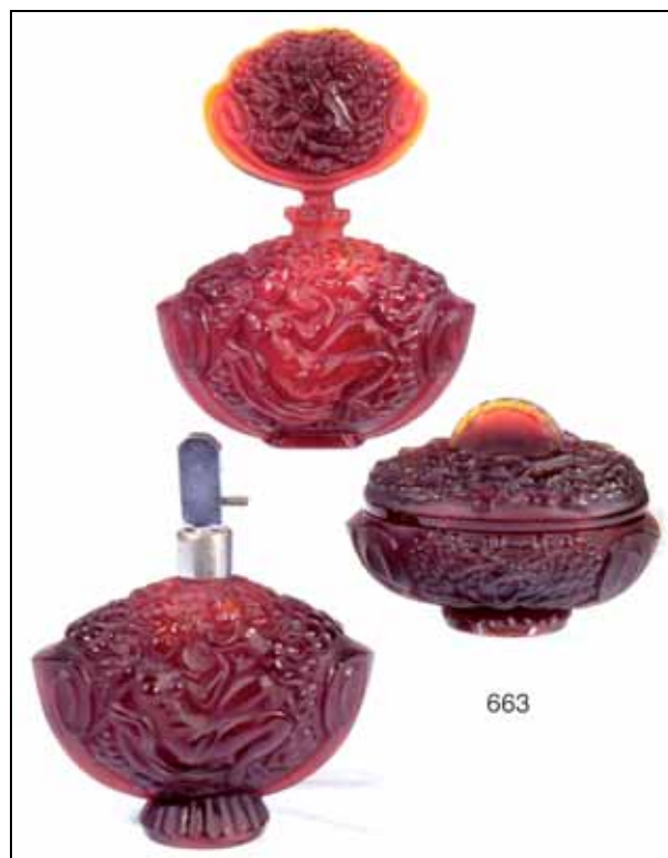
Riedel, Polaun / Polubný, lagerten und 1945 mit allem Drum und Dran enteignet und verstaatlicht wurden.