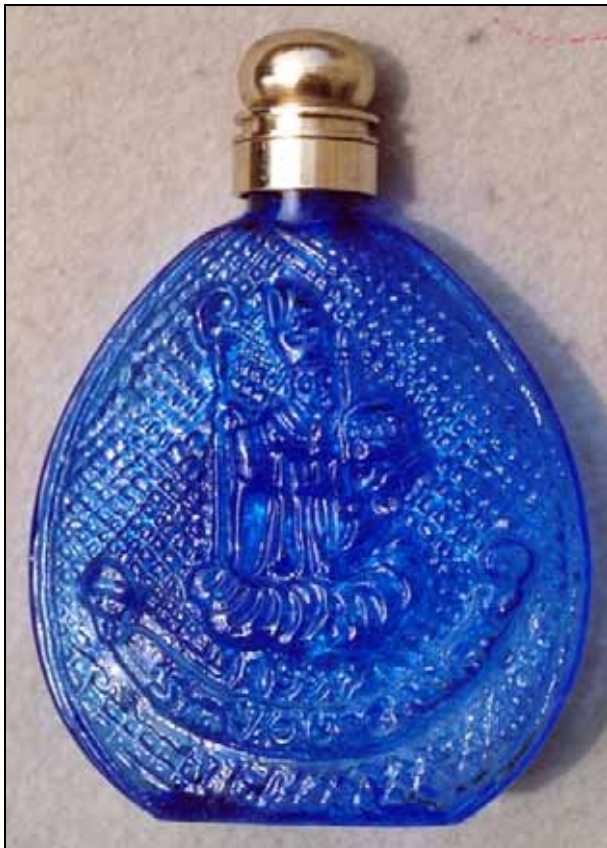
Abb. 2007-3/106 „Wolfgangflascherl“, Metallschraubverschluss Vorderseite Hl. Wolfgang mit Kirchenmodel auf einer Wolke Rückseite Falkensteinkapelle, Hirschpaar und Gämse kobalt-blaues, form-geblasenes Glas, H 12 cm, B 8,9 cm Boden glatt, ohne Bodenstern, ohne Abriss, Varianten Sammlung Stopfer Glashütte Hüttenstein bei St. Gilgen, 20. Jhd.