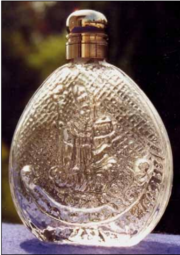
Abb. 2007-3/107 „Wolfgangiflascherl“, Metallschraubverschluss Vorderseite Hl. Wolfgang mit Kirchenmodel auf einer Wolke Rückseite Falkensteinkapelle, Hirschpaar und Gämse farbloses, form-geblasenes Glas, H 12 cm, B 8,5 cm Boden glatt, ohne Bodenstern, ohne Abriss, Varianten Sammlung Stopfer Glashütte Hüttenstein bei St. Gilgen, 20. Jhd.