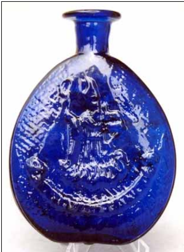
Abb. 2007-3/100 „Wolfgangiflascherl“ Vorderseite Hl. Wolfgang mit Kirchenmodell auf einer Wolke Rückseite Falkensteinkapelle, Hirschpaar und Gämse kobalt-blaues, form-geblasenes Glas, H 12,2 cm, B 8,9 cm Bodenstern als Windrose und Abriss Sammlung Stopfer Glashütte Hüttenstein bei St. Gilgen, 18. Jhdt.

Auf der Vorderseite der kobalt-blauen Pilgerflasche ist der Heilige Wolfgang, der Wallfahrtspatron, mit Stab und Kirchenmodell als Dreiviertelfigur auf einer Wolke schwebend abgebildet. Darunter auf schmalen Schriftband „St. Wolfgang“. Auf der Rückseite ist die Falkensteinkapelle oberhalb von St. Gilgen und St. Wolfgang am Wolfgangsee / Abersee mit Hirschpaar und Gämse dargestellt. Die Standfläche der alten Flasche ziert ein Bodenstern in Form einer Windrose, inmitten ein Abriss.