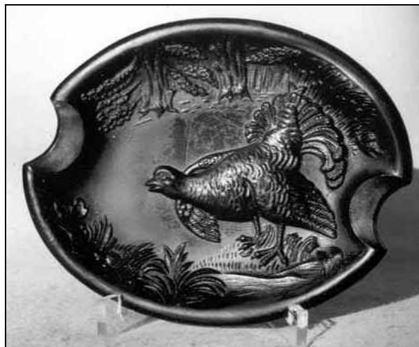
Abb. 2002-1/167 neu , Abb. 2002-1/168 und Abb. 2002-1/169 Aschenschale mit Auerhahn, oval opak-schwarzes Pressglas, H 1,5 cm, B 12,2 cm, L 15,2 cm Sammlung Stopfer Unterseite mit russischer Inschrift „ ОТЬМ.Ф. 1913 на10ЛѢТЬ “ und „ Musterschutz “ Zabkowice, Russisch Polen, ab 1913 s. MB Zabkowice, um 1920, Tafel 71, Nr. 1413

Jahresangabe wurden vor dem 1. Weltkrieg datiert: 1913 und 1914 . Nach 1918 - als Polen selbständig geworden war - wurden in Zabkowice Pressgläser nicht mehr mit eingepressten Stempeln datiert.