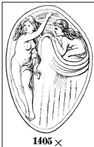
Abb. 2007-4-01/054 (Ausschnitt) MB Zabkowice, um 1920, Tafel 71. Nr. 1405 x, Aschenschale MB Sammlung Geiselberger