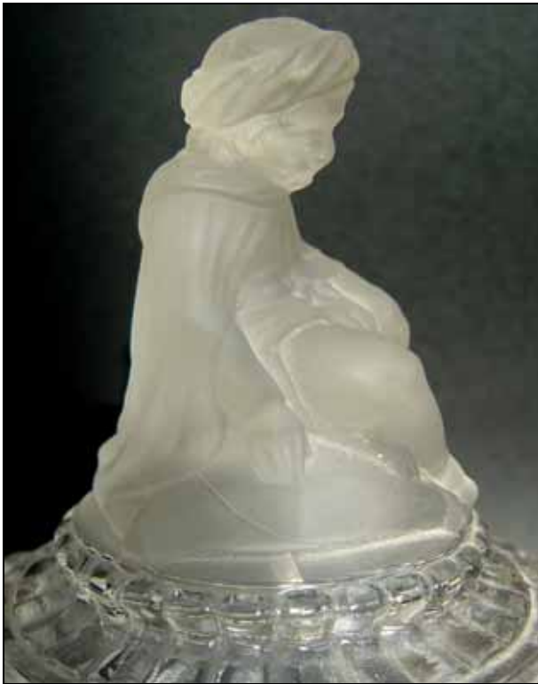
Abb. 2001-04/355 (Ausschnitt) MB Baccarat 1893, Pl. 58, Presse-papiers (Sujets dépolis) No. 4923 A, Mahout der Elefanten auf Dose No. 4945 D 13,7 cm Reprint Edition Collections Livres Brüssel 2000

Abb. 2008-1/155 Zuckerdose - zwei Elefanten mit Mahout farbloses Pressglas, H 23,5 cm, D Rand 13,3 cm / 17,5 cm Sammlung Christoph unter dem Boden eingepresste Marke „BACCARAT“ s. MB Baccarat 1893, Planche 66, No. 4945 A vgl. MB Reich 1880, Tafel B, Nr. 1727