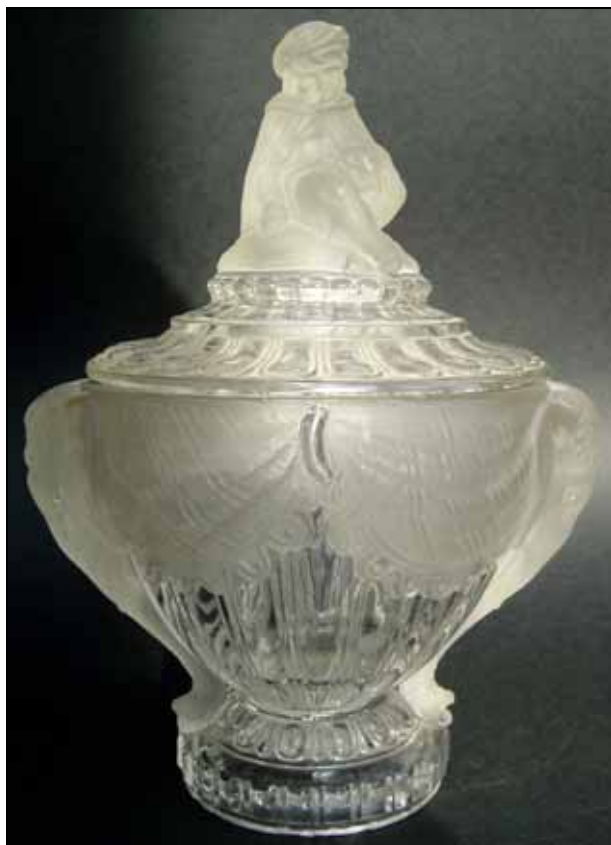
Abb. 2008-1/152 Zuckerdose - zwei Elefanten mit Mahout farbloses Pressglas, H 23,5 cm, D Rand 13,3 cm / 17,5 cm Sammlung Christoph unter dem Boden eingepresste Marke „BACCARAT“ s. MB Baccarat 1893, Planche 66, No. 4945 A vgl. MB Reich 1880, Tafel B, Nr. 1727

Das Bild aus dem Katalog S. Reich & Co. 1880 ist besser als das aus den Katalogen Baccarat 1870, 1885 und 1893. Zum Vergleich mit den Dosen ist es also besser geeignet. Wichtige Unterschiede zwischen den Zeichnungen von Baccarat und Reich sind nicht zu erkennen. Der Junge auf dem Elefanten hat einen leicht veränderten Turban. Kopieren konnte man damals noch nicht. Man musste also die Vorlage abzeichnen und konnte sie dabei - je nach dem Können des Zeichners - auch verändern.