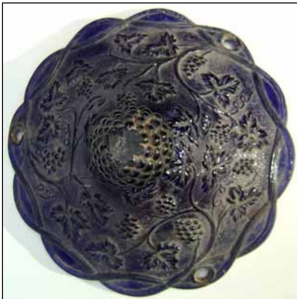
Abb. 2008-1/192 Ampel für Pflanzen blau-violettes dunkles Pressglas, H 13 cm, D 23 cm Sammlung Christoph ohne Marke s. MB Bayel 1886, Planche 65, No. 382, Suspension raisin siehe auch „suspension“ MB Landrecies 1885, Planche 22, No. 106, und Tarif Portieux 1886, Planche 180, No. 3218

SG: Wie die opak-hellblaue Schale mit Efeu-Blättern und Ranken konnte diese Schale mit Weintrauben und -ranken ebenfalls nicht für die Beleuchtung dienen - dafür war auch diese Schale zu klein und zu flach. Sie war sicher als Schale für Pflanzen gedacht, die man irgendwo aufhängen konnte. Die Pflanzen konnten in der Schale wuchern und ihre Ranken konnten über die Ampel herunter hängen. Eine andere Frage ist, ob diese Schalen als „Blumentopf“ wirklich funktioniert haben.