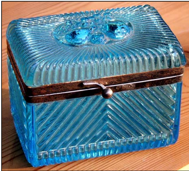
Abb. 2008-1/226 Zuckerkasten mit Früchten und schrägen Walzen Metall-Montierung blaues Pressglas, H 8,5 cm, L 10,5 cm, B 7,2 cm Sammlung Maierholzner s. MB Schreiber 1915, Tafel 76, Nr. 4103

SG: Dieser Zuckerkasten mit Früchten und schrägen Walzen ist die erste blaue Dose, die ich von Schreiber gesehen habe.