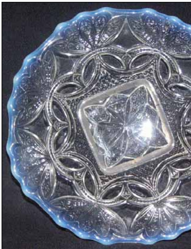
Abb. 2008-1/352 kleiner Teller mit reichem Pseudoschliff-Dekor farbloses Pressglas, H 2,5 cm, D 14 cm Rand mit bläulich opalisierender Anlauffarbe Sammlung Rühl & Sadler s. MB Brockwitz 1915, Tafel 36, Nr. 8019, Service Louise

SG: Wenn ich mich nicht täusche, ist dies das erste Pressglas von Brockwitz mit Anlauffarben , das ich bisher gesehen habe. Der bläulich opalisierende Rand war vor allem bei der Fenner Glashütte vor und um 1900 in Mode. Davon wurden viele Gläser gefunden. Man brauchte eine besondere Glasmasse, wahrscheinlich mit einem Zusatz von Fluorsalzen. Nach dem Pressen musste man das Glas noch einmal in ein scharfes Feuer halten. Damit trübten sich die Zuschlagstoffe in dieser opalisierenden Farbe je nach Einwirkung schwach oder stark ein. Erfunden wurde dieses Verfahren in England, wo vor allem George Davidson & Co., Teams Glass Works, Gateshead-on-Tyne solche Pressgläser mit opak-gelbem oder opak-hellblauem Rand in Massen herstellte: „ Yellow & Blue Pearlina “.