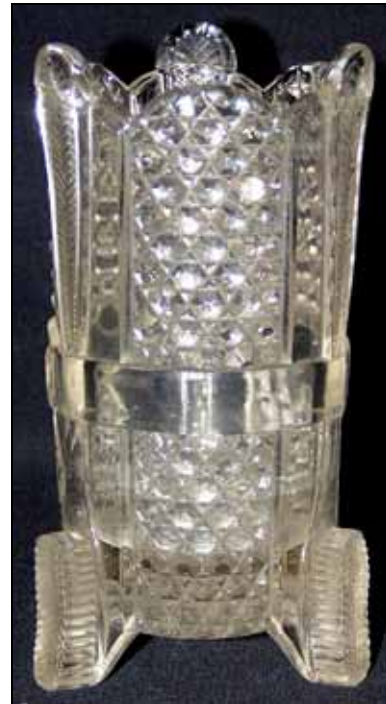
Abb. 2002-5-2/130 Haupt-Katalog Brockwitz 1915, Tafel 132, Diverse Artikel Sammlung Neumann

Abb. 2008-1/353 Zahnbürstenhalter farbloses Pressglas, H ca. 12 cm, D oben ca. 6 cm Sammlung Rühl & Sadler s. MB Brockwitz 1915, Tafel 132, Nr. 6950