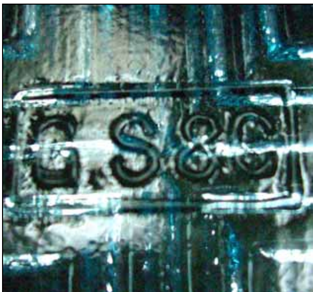
Abb. 2008-2/184 Schale mit Sternen-Dekor blaues Pressglas, H 4 cm, D 24 cm Sammlung Jakob vgl. Schale Roese, farbloses Pressglas, PK Abb. 2004-3/170 vgl. Schale Geiselberger, blaues Pressglas, Abb. 2005-1/634 Marke „G.S. & C.“ in Rechteck innen im Boden der Schale Glashütte AG vorm. Gebrüder Siegart & Co., Stolberg bei Aachen