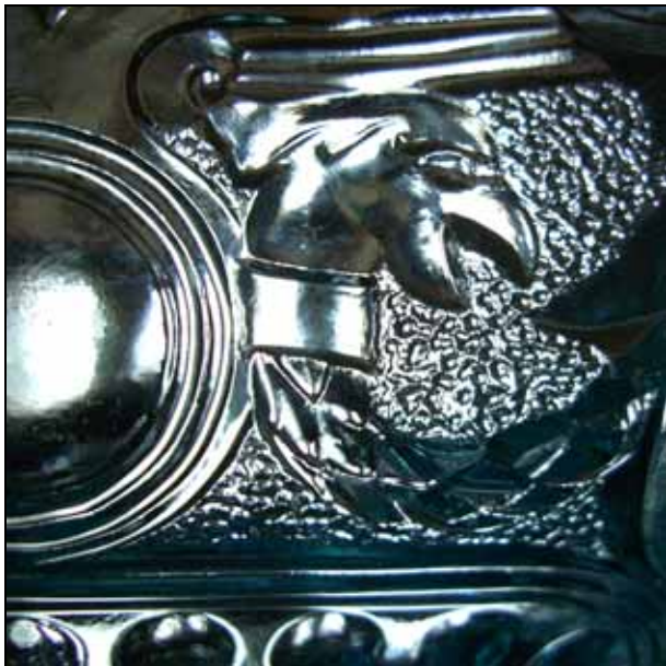
Abb. 2008-2/183 Schale mit Oliven-, Girlanden- und Ranken-Dekor Grund unregelmäßiges Sablée blaues Pressglas, H 5,5 cm, B 18,3 x 18,3 cm Sammlung Jakob vgl. Schale Roese, farbloses Pressglas, PK Abb. 2002-2/048 Marke „G.S & C.“ in Rechteck innen im Boden der Schale Glashütte AG vorm. Gebrüder Siegart & Co., Stolberg bei Aachen

Die Schweizer Verwandtschaft ist noch immer auf der Suche nach Dokumenten.