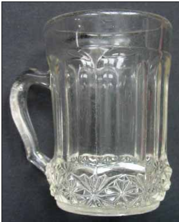
Abb. 2008-2/026 Henkelbecher mit Stern-Muster am Boden farbloses Pressglas, H xxx cm, D xxx cm eingepresste russisch-kyrillische Inschrift „ОтъМ.Ф. 1903 на10льть“ Sammlung Peltonen s. MB Zabkowice um 1910, Tafel 9, Nr. 157 und Nr. 157/K mit Presstempel „ОтъМ.Ф. 1903 на10льть“

„восстание“ heisst Aufstand und wird z.B. gebraucht in http://www.hagalil.com/judentum/feiertage/av/9-aw.htm : Der Grosse Aufstand der Kanaim (Eiferer, Zeloten) [66-70 n.Chr. gegen die Römer mit dem Fall von Jerusalem] - Великое восстание Коанимов (Ретивых Целотов). In Russland bedeutet das Wort auch die Revolution von 1917. Der Teller muss nicht unbedingt in einer russischen / polnischen Glasfabrik entstanden sein, er könnte auch als Andenken-Teller für eine andere „Fabrik Revolution“ z.B. in Deutschland von Streit, Berlin - Hosena / Hohenbocka, gemacht worden sein.