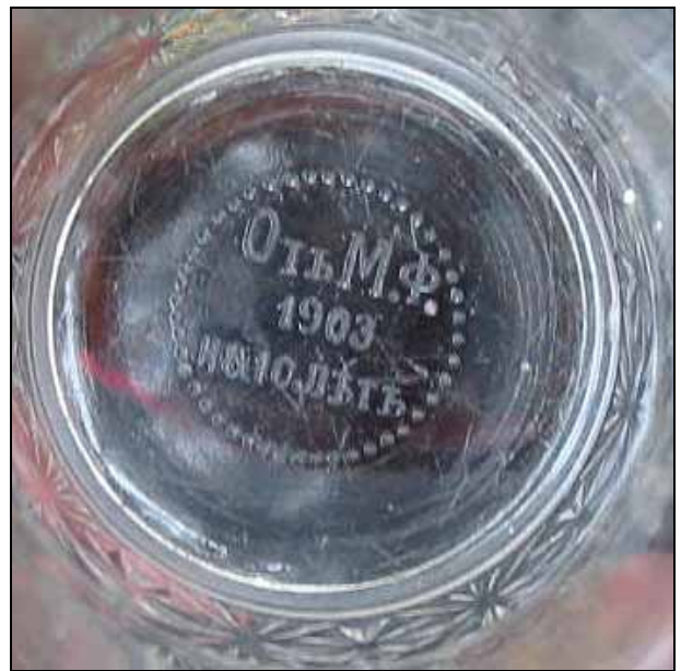
Abb. 2007-2-04/015 (Ausschnitt) MB Pressglas Zabkowice, um 1910, Tafel 9, Henkelbecher Nr. 157 MB Privatsammlung