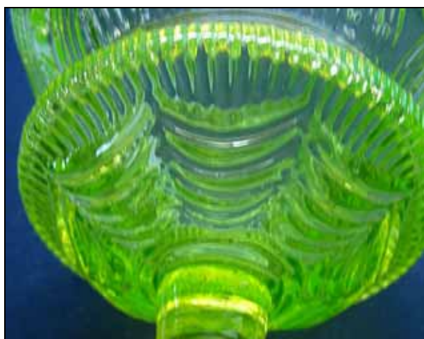
Abb. 2007-4/084 Zuckerschale, Deckel fehlt Kuppa mit Spitzbögen und Sternen, Boden Ranken uran-grünelbes, form-geblasenes Glas H 13,8 cm ohne Deckel, D 11 cm, D unten 7,9 cm Sammlung Peltonen Hersteller unbekannt, Böhmen / Steiermark, um 1850

Das dritte Glas ist eine Fußschale mit Deckel. Bei mir fehlt leider der Deckel. Eine gleiche Fußschale ist in PK 2006-3/044 auf Seite 68 dargestellt und der Glashüt-