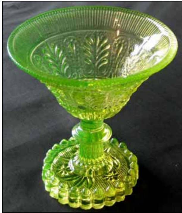
Abb. 2007-2/055 Fußschale (Zuckerschale?) Kuppa mit Palmetten, Perlen und Rillen, Boden Blütenzweig uran-grünes, form-geblasenes Glas H 13,3 cm, D oben 12,5 cm, D unten 8,3 cm Sammlung Vogt Böhmen / Mähren oder Steiermark, um 1850?