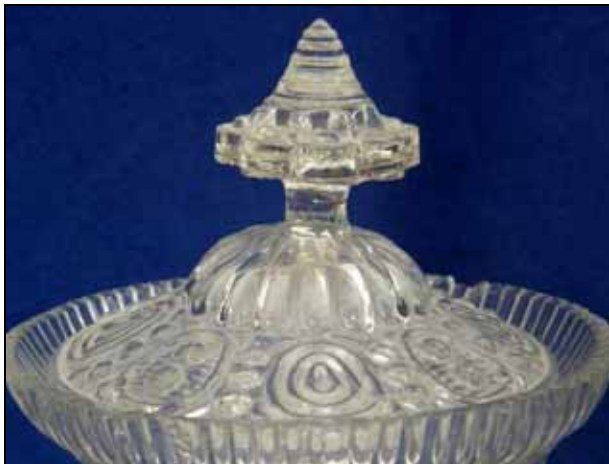
Abb. 2008-4/130 Zuckerschale mit Deckel Kупpa mit Ovalen, Punkten und Rillen, Boden mit Blumen-Motiv farbloses, form-geblasenes Glas H 21 cm, D Rand 10 cm, D Fuß 8 cm Sammlung Andersen Hersteller unbekannt, Böhmen oder Mähren, nach 1850