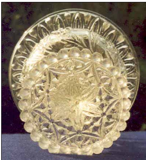
Abb. 2002-5/164 Zuckerschale Kuppa mit Blüten, Ranken und Blattfries, Boden Sechseck farbloses, form-geblasenes Glas H 12,7 cm, D oben 13,1 cm, D unten 8 cm Sammlung Stopfer Hersteller unbekannt, Böhmen oder Mähren, nach 1850

Die letzte Schale wird von einer sechseckigen Bodenplatte mit stern-förmigem, geometrischem Muster getragen. Der Rand ist geriffelt, die Oberseite glatt.