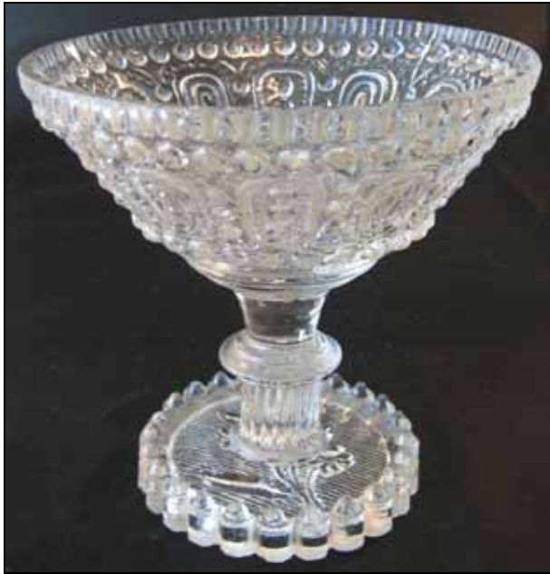
Abb. 2007-2/054 Zuckerschale, Deckel fehlt Kuppa mit Ovalen, Punkten und Rillen, Boden Blütenzweig farbloses, form-geblasenes Glas H 12,7 cm, D oben 13,0 cm, D unten 8,3 cm Sammlung Vogt Böhmen / Mähren oder Steiermark, um 1850?

Interessant sind die Bodenplatten, die auf geriffeltem Grund Blütenzweige und Blätter zeigen. Die Muster unter den Bodenplatten sind nicht identisch.