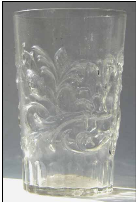
Abb. 2004-2/107 a/b (Vorderseite wie Abb. 2000-5/089) Andenken-Becher mit ovalem Schild und Ranken im Schild Portrait eines Regenten in Uniform Aufschrift „ CAROL II “, wohl König Carol II. von Rumänien geb. 1893, reg. 1930-1940, gest. 1953 farbloses, form-geblasenes Glas, Rand angeschliffen und poliert, H 11,0 cm, D 7,0 cm Sammlung Geiselberger, FG-017 Hersteller unbekannt, um 1920, Rumänien ? PK 2008-4, SG: Hersteller unbekannt, um 1930

Der Henkelbecher Sammlung Stopfer ist sicher zur Einsetzung 1930 gemacht worden. Auch der formgeblasene Becher Sammlung Geiselberger kann erst um 1930 entstanden sein.