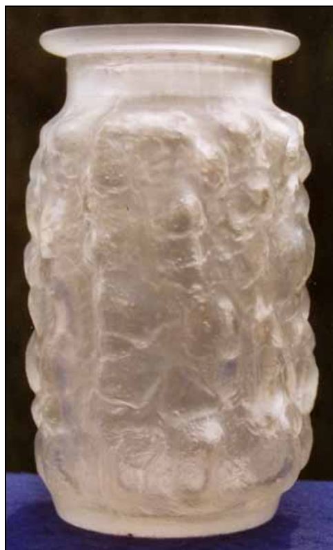
Abb. 2008-4/327 Vase mit Beulen-Struktur farbloses, mattiertes Pressglas, H 15,5 cm, D 8,5 cm Sammlung Stopfer Entwurf Vladislav Urban Sklo Union, Libochovice, Nr. 3386/M/15 cm