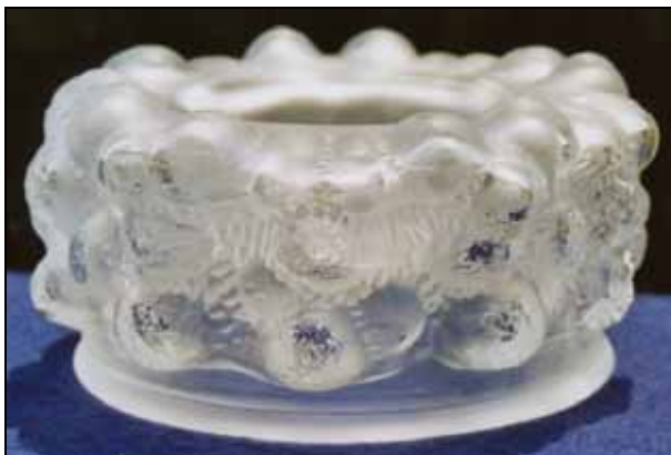
Abb. 2008-4/331 Ascher mit Beulen-Struktur farbloses, mattiertes Pressglas, H 6 cm, D 12 cm Sammlung Stopfer Entwurf Vladislav Urban Sklo Union, Libochovice