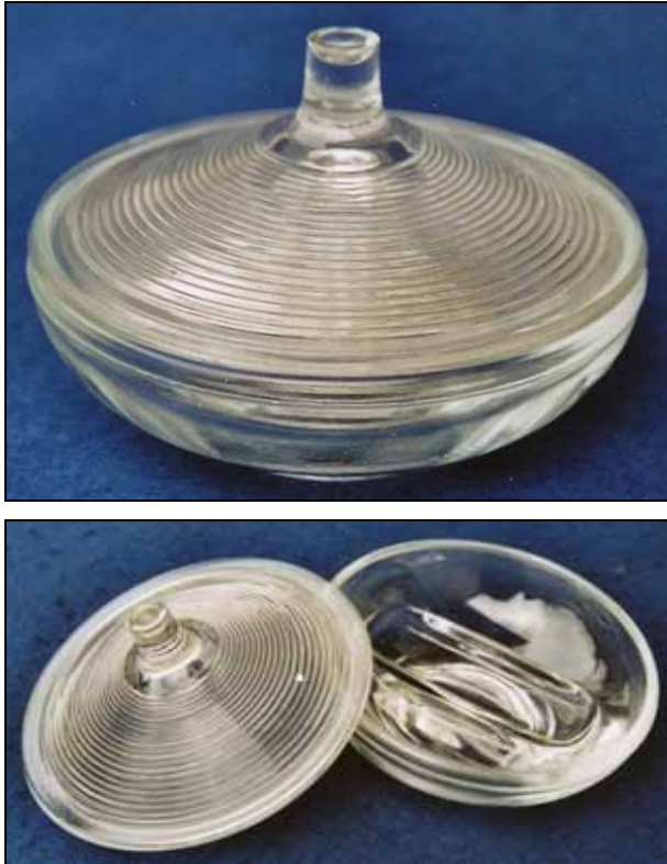
Abb. 2008-4/341 Schale für Salz und Pfeffer mit Deckel farbloses Pressglas, H 7,3 cm, D 10,6 cm Sammlung Stopfer Entwurf Vladislav Urban Sklo Union, Libochovice, Nr. 3352?