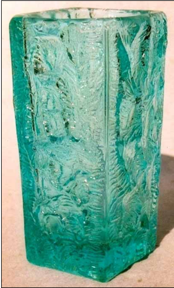
Abb. 2008-4/338 Vase mit Borke-Struktur türkis-farbenes Pressglas, H 16 cm, D 8 cm Sammlung Stopfer Entwurf Vladislav Urban Sklo Union, Rosice, 1969, Nr. 1502