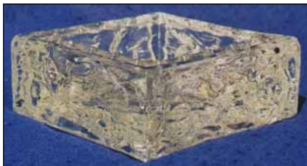
Abb. 2008-4/335 Ascher mit Borken-Struktur farbloses Pressglas, H 6 cm, B 15 / 15 cm Sammlung Stopfer Entwurf Vladislav Urban Sklo Union, Rosice, 1969, Nr. 1503