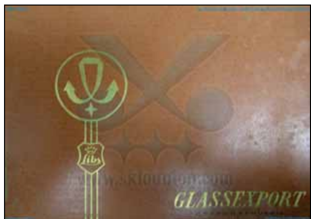
Abb. 2009-1/377 MB Libochovice vor 1958 GLASSEXPORTE CZECHOSLOVAKIA, Marken „Schleifen“ und „Wappen mit Krone und Libs“ aus Newhall, Sklo Union ..., Braintree 2008, CD „Catalogues“

Das Problem der Sammler von Pressgläsern, die man jetzt in MB Libochovice 1958 findet, bleibt bestehen: wer hat diese interessanten Gläser vor 1939 hergestellt?