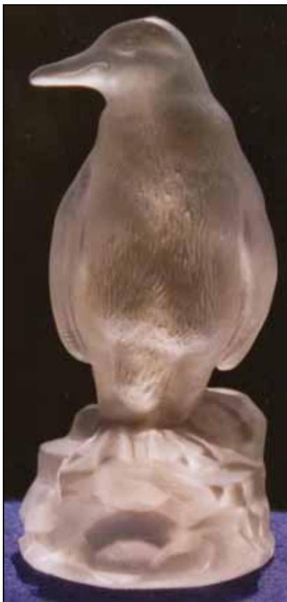
Abb. 2009-1/386 Pinguin als Figur farbloses, mattiertes Pressglas, H 14 cm Pinguin als Blumenbock farbloses, mattiertes Pressglas, H 19,3 cm Sammlung Stopfer s. MB Libochovice vor 1958, Tafel 31, Nr. 1995/1996