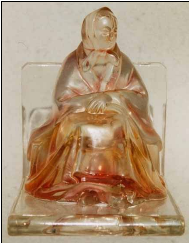
Abb. 2009-1/378 Buchstütze als alte Frau mit Kopftuch farbloses Pressglas, H 15 cm, B 11,3 cm, L 12,2 cm teilweise leicht rosa besprüht Sammlung Stopfer s. MB Libochovice vor 1958, Tafel 53, Nr. 2080

Von den modernen tschechischen Glaskünstlern findet man keine Gläser. Das hat seinen Grund darin, dass fast alle tschechischen Glaskünstler erst ab den 1960-er Jahren Entwürfe für die Pressglaswerke geliefert haben.