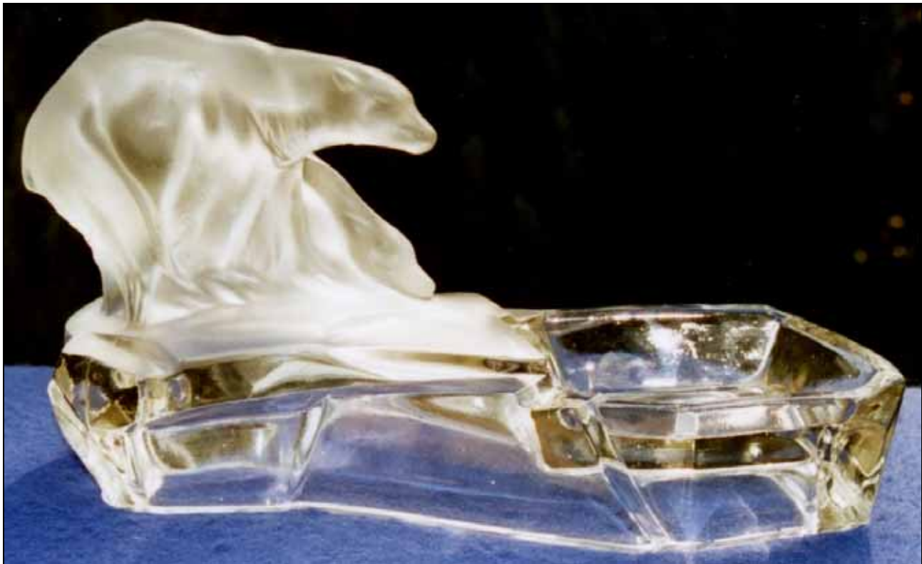
Abb. 2009-1/376 Eisbär als Aschenbecher, farbloses, mattiertes Pressglas, H 10 cm, B 13 cm, L 23 cm Sammlung Stopfer s. MB Libochovice vor 1958, Tafel 53, Nr. 2294, ab ca. 1935 hergestellt!