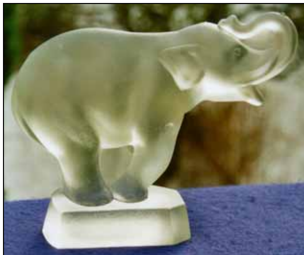
Abb. 2009-1/380 Elefant farbloses, mattiertes Pressglas, H 14 cm, B xxx cm, L 18,5 cm Sammlung Stopfer s. MB Libochovice vor 1958, Tafel 53, Nr. 2255