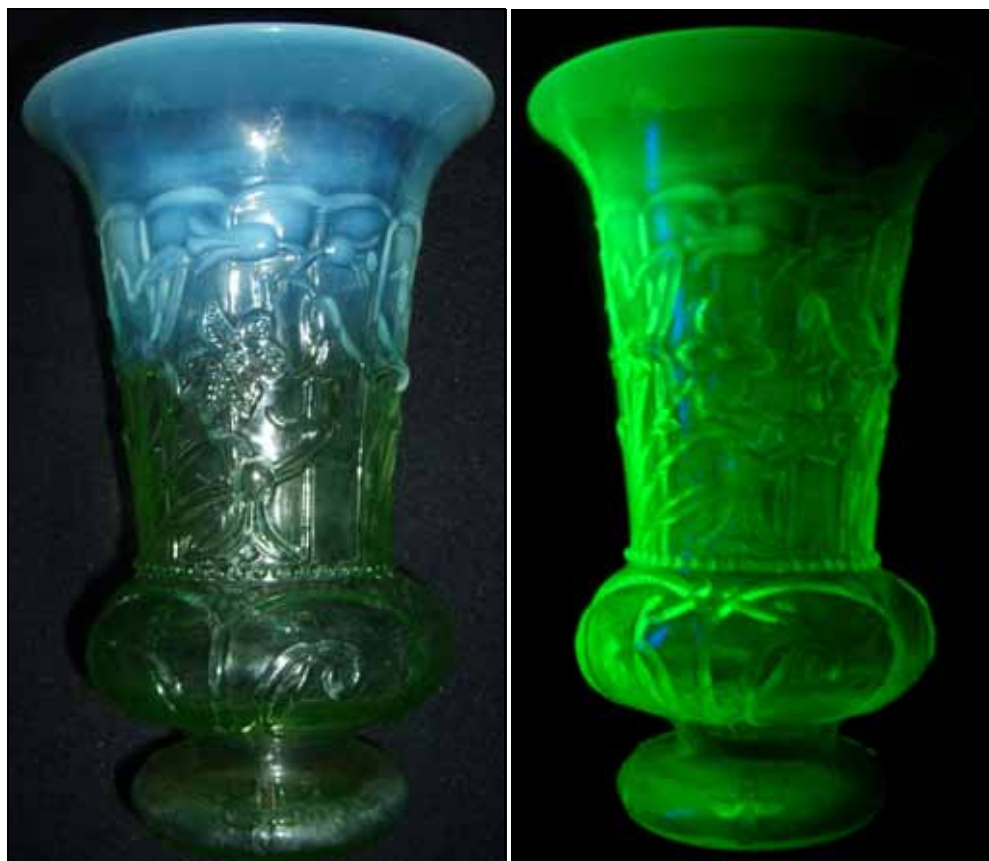
Abb. 2009-1/097 und Abb. 2009-1/098 Jasmin-Vase mit Blüten und Blättern, opaleszierendes, uran-grünes, press-geblasenes Glas, H 17 cm, D Rand 11 cm, D Fuß 6,6 cm Sammlung Groß

PK 2009-2, Christoph: s. MB Meisenthal 1927 / 1930, Vase „Ananas“