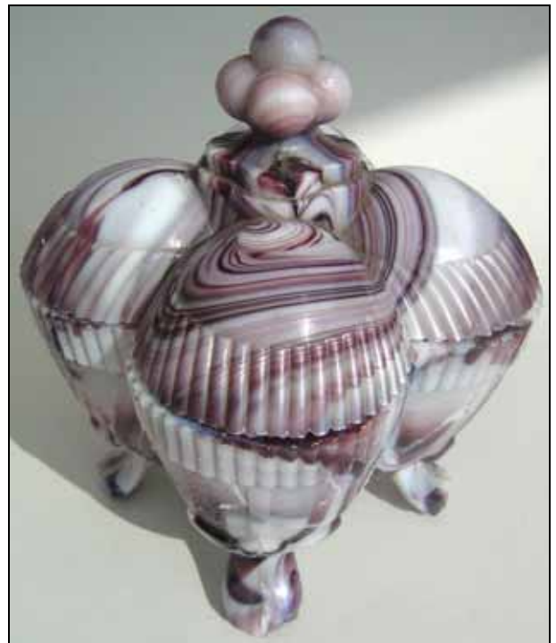
Abb. 2009-2/123 Deckeldose mit vier Teilen - wie für Eier vier Tierfüße, Deckelknopf mit 5 Kugeln unregelmäßige Körnung opakes, dunkel-violett und weiß marmoriertes Pressglas H 14 cm, B 11 x 11 cm Sammlung Christoph ohne Marke s. MB Sars-Potieres 1885, Planche 86, No. 1967 „Sucrier anglais, forme oeuf“ vgl. Eierbecher MB Sars-Potieres 1888, Planche o.No., No. 2263, „Franc maçons ... à liqueur“