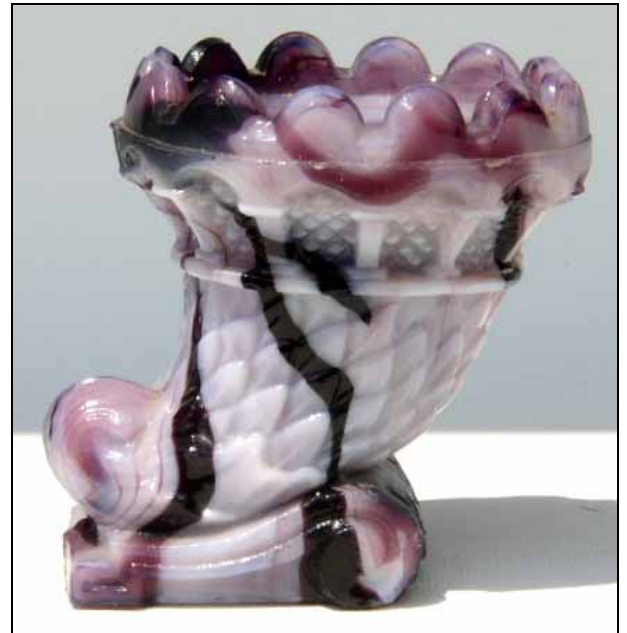
Abb. 2004-1/151 Vase mit drei Delphinen und Muschel-Dekor, 3 FüÙe Porte-Allumette „Dauphin“ opak-„purpur-malachit-marmoriertes“ Pressglas, H ??? cm http://1st-glass.1st-things.com ... gallery-slag/slides/purplemalachitespillvase.html „French?, c. 1880s“ s. MB Sars-Poteries 1885, 3. Partie, Planche 94, Objets divers, No. 2136, PK Abb. 2006-2-05/128