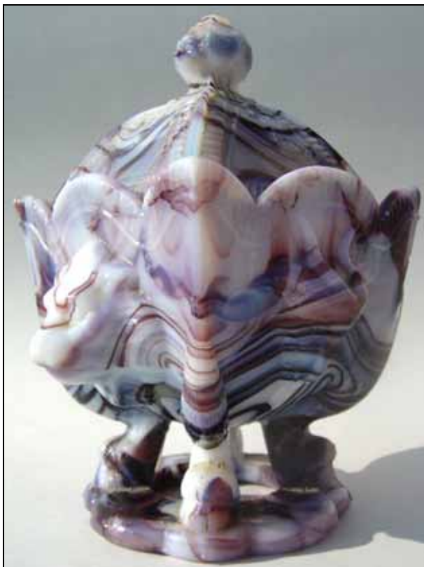
Abb. 2009-2/121a Deckeldose mit zwei Löwen- und zwei Bocksköpfen, vier Bocksfüße, Deckel mit zwei Löwen- und zwei Bocksköpfen opak, dunkel-violett und weiß marmoriertes Pressglas H 17,5 cm, B 12 x 12 cm Sammlung Christoph ohne Marke, Hersteller unbekannt, Frankreich, um 1885 vgl. MB Sars-Potieres 1885, Planche 86, No. 1967 „Sucrier anglais, forme œuf“

Vielleicht wäre es interessant, diese Dose mit anderen, marmorierten Gegenständen zu vergleichen oder mit den gleichen Motiven (Löwe und Bock).