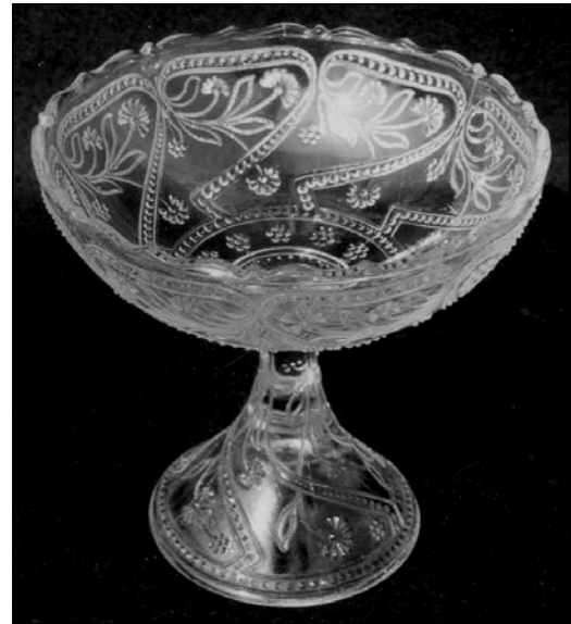
Abb. 2007-1-10/002k Aufsatz mit Blüten und Bändern farbloses Pressglas, H 14,5 cm, D 26 cm Sammlung Stopfer, s.a. Sammlung Geiselberger PG-1043 s. MB Pressglas Hersteller unbekannt 1930, Tafel 12, Nr. 1109 MB Archiv Rona Crystal, Lednické Rovne