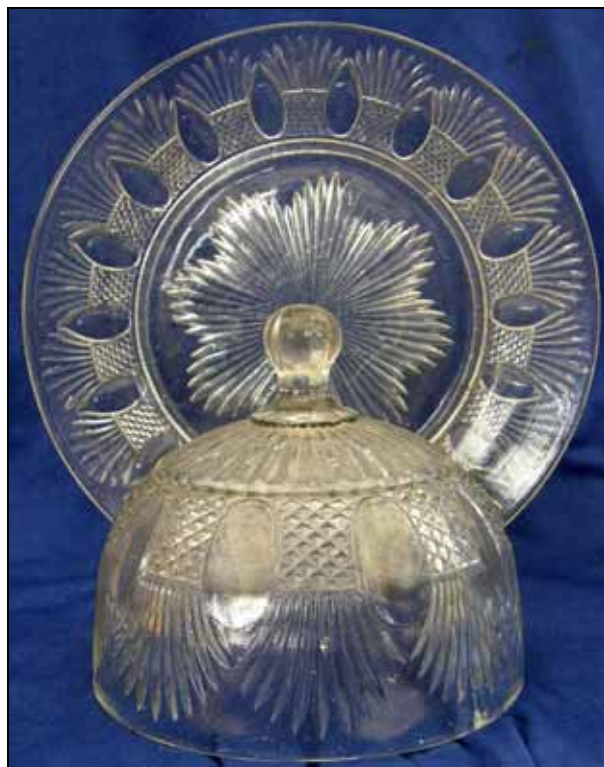
Abb. 2009-3/124 Käseglocke mit Pseudo-Schliffdekor farbloses Pressglas, H 12 cm, D 14,5 cm, Teller D 24 cm Sammlung Andersen Schweden, Fåglavik 1900, Nr. 151, s.a. PK 2000-4/163