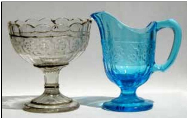
Abb. 2004-3/140 rechts Fußschale, Band mit stilisierten Blüten und Blättern als Grund grob-unregelmäßiges Perlchen-Muster (sablée) blaues Pressglas, H xxx cm, D xxx cm Sammlung Zeh ohne Marke, Hersteller unbekannt, Deutschland, um 1900