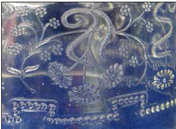
Abb. 2007-1-10/002b und Abb. 2007-1-10/002e rechts Tafelaufsatz mit Blüten und Bändern farbloses Pressglas, H 14,5 cm, D 26 cm Sammlung Geiselberger PG-1043 s. MB Pressglas Hersteller unbekannt 1930, Tafel 12, Nr. 1109, MB Archiv Rona Crystal, Lednické Rovne