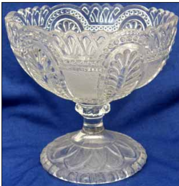
Abb. 2009-3/129 links „Vase Médicis“ mit neo-gotischen Motiven und Diamanten farbloses Pressglas, H 13,2 cm, D 9,4 cm Sammlung Andersen s. MB Launay, Hautin & Cie. um 1840, Planche 26, No. 1399 B. Baccarat, „Vase Médicis m. sablée à arcades gothiques“