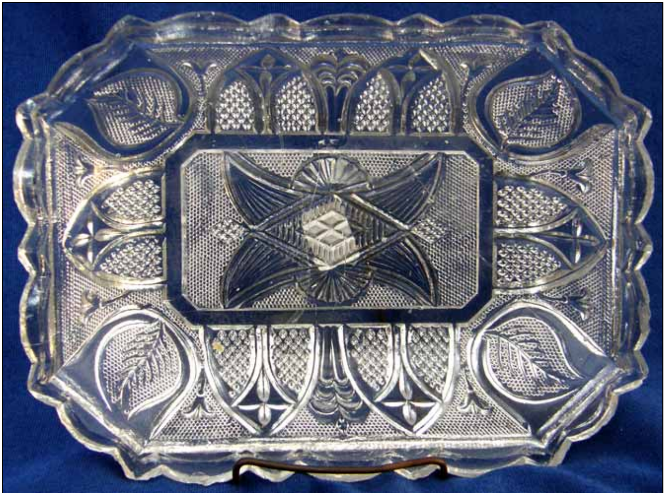
Abb. 2009-3/117 Rechteckige Schale mit Pseudo-Schliffdekor, farbloses Pressglas, H 3 cm, B 11,5 cm, L 15,5 cm Sammlung Andersen Hersteller unbekannt, s. McKearin, American Glass, Plate 150