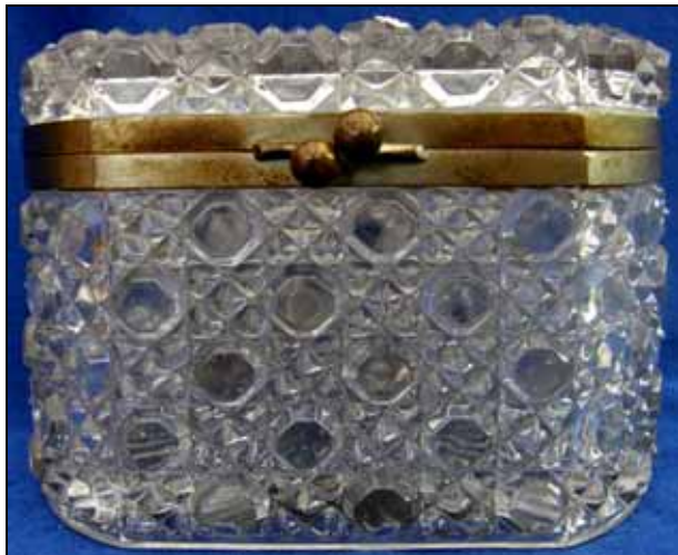
Abb. 2009-3/133 Zuckerkasten mit Pseudo-Schliffdekor farbloses Pressglas, H 8,5 cm, B 9 cm, L 13,5 cm Sammlung Andersen im Boden eingepresste Marke „B“ Herst. unbekannt, Deutschland?, USA?, um 1900? PK 2008-1, Antique Estate French Crystal Bronze Ornate Casket Box, Marke „B“ PK 2008-1, Lethbridge: nicht Belmont, vielleicht Central Glass Co., Wheeling, West Virginia, USA, circa 1887