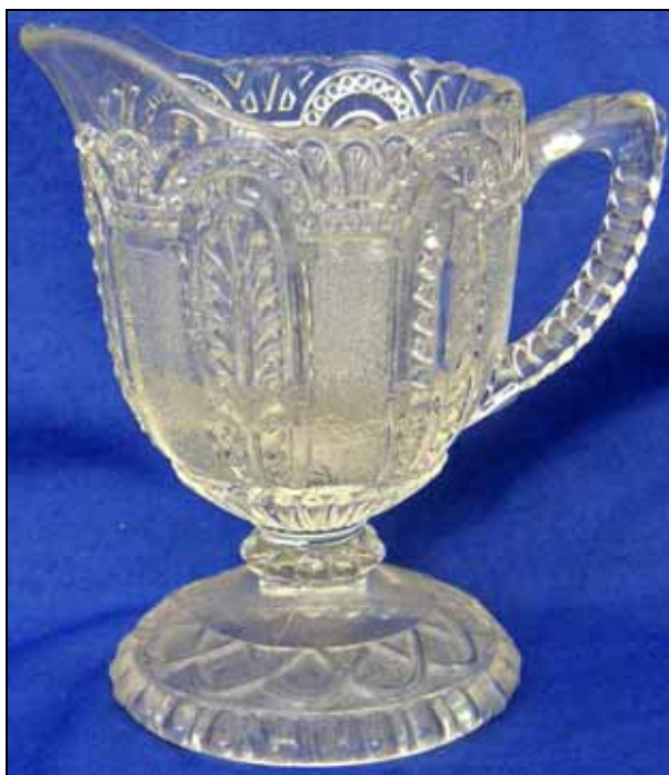
Abb. 2009-3/128 Fußschale mit Blättern, Perlen und Körnung farbloses Pressglas, H 11,5 cm, D 6,5 cm Sammlung Andersen s. MB Ehrenfeld 1886, Tafel 53, Nr. 1153, Abb. 2000-6/804