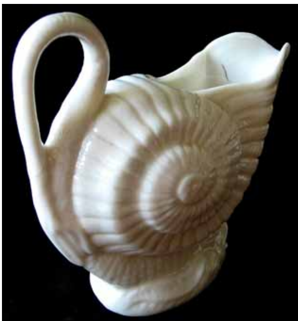
Abb. 2009-3/215 Sahne- oder Milchkännchen in Form einer Nautilus-Muschel opak-weißes Pressglas, H 11,5 cm, B 12 cm, T 5,5 cm Sammlung Vogt, PV-593 Hersteller unbekannt, England, um 1880

Abb. 2009-3/214 rechts Deckeldose mit liegendem Hund auf einer Schale mit Muscheln opak-weißes Pressgl., H mit Deckel 8,8 cm, B 6,7 cm, L 13 cm Sammlung Vogt, PV-592 Hersteller unbekannt, England, um 1880