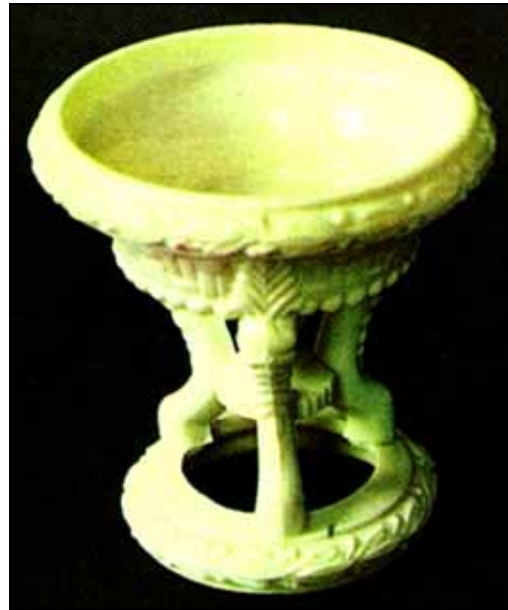
Abb. 2009-3/220 (Ausschnitt) Schale für Kleinkram [pin tray], opak-gelbes Pressglas Sowerby's Ellison Glass Works, Gateshead, Marke Sowerby Queens Ivory Ware, reg. 13. February 1877 aus Lattimore 1979, S. 88 f., plate III

We believe that this substance has a great future before it, and that it is capable of very much in the hands of the ironworker, for it is to this handicraft that the design and make are indebted rather than the glass-maker. All we have said applies also to an article manufactured by the same firm, and of the same body, which they call "Sorbini" or "Malachite". Perhaps the former name is the most suitable, for to manufacture Malachite in blue and brown , in addition to its natural colour green , is to "add a perfume to the violet". It is not often that art beats nature in variety, but it is so in this case, and very beautiful the varieties are. The designs in this body differ greatly from those in the "Vitro-Porcelain", great care being taken that the exquisite lines in the Malachite are left unbroken - a precaution which adds greatly to the beauty, making the articles appear as though manufactured by the Malachite cutters of Russia. " [Pottery Gazette Nov. 1877, S. 182]