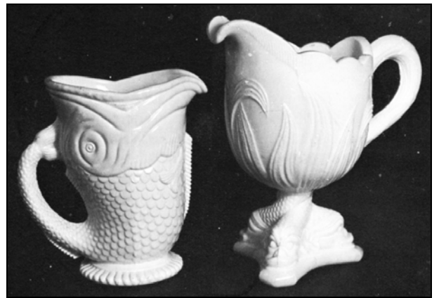
Abb. 2009-3/224 W. H. Heppel, Newcastle, Zuckerschale, Butterdose, Sahnekännchen, opak-weißes Pressglas, reg. 13. December 1881 aus Lattimore 1979, S. 109, fig. 70 s.a. Slack 1987, S. 111, plate XXIX & XXX, reg. 6. December 1881