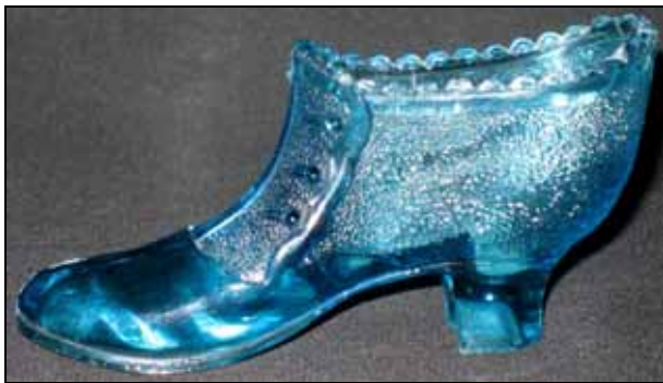
Abb. 2009-4/280 Damenschiefelette, geknöpft blaues Pressglas, H cm, B cm, L cm Sammlung Maierholzner vgl. Preis-Kurant Preß-Glas Inwald 1914, Abb. 2002-4-1/027 Bonbonniere Nr. 6531

SG: Es ist zwar nicht sicher, aber so elegante Damenschuhe aus Pressglas habe ich bisher noch nicht gesehen! Wahrscheinlich hat Inwald nicht nur Damenschuhe mit „Mascherl“ gemacht, sondern eben auch Stiefeletten mit Knöpfen. Diese blaue Glasfarbe habe ich allerdings bisher noch bei keinem Pressglas gefunden, das Inwald zugeschrieben werden konnte.