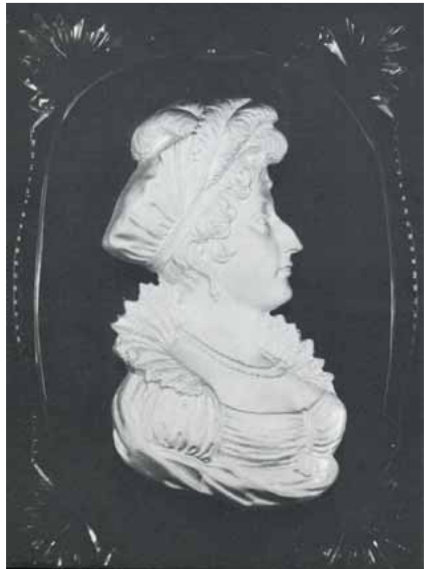
Abb. 2005-2/262 Paste Marie Thérèse, Duchesse d'Angoulême (1778-1851) geschliffene Plakette, 1815-1830 auf der Rückseite „Desprez, rue des Récolets, no. 2 à Paris“ aus Boisgirard 2002-03, S. 2 f., Nr. 2