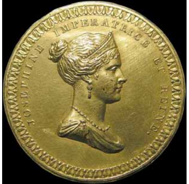
Abb. 2009-4/030 Medaille JOSEPHINE IMP. ET REINE (nach ihrem Tod 1814) A L'IMMORTELLE IMPÉRATRICE DES FRANÇAIS Inside the wreath, JOËSPHINE TASCHER DE LA PAGERIE NÉE À LA MARTINIQUE EN 1765 MARIÉE AU GÉNÉRAL BONAPARTE EN 1796 DIVORCÉE EN 1809 MORTE A LA MALMAISON EN 1814 sign. ???; Essling 2976 http://www.napoleonicmedals.org/coins/pe-2976.htm