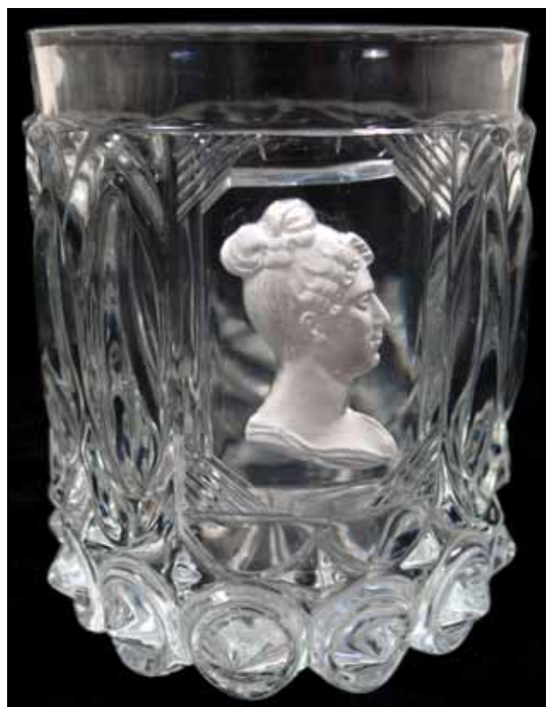
Abb. 2009-4/002 Becher Cristallerie de Baccarat, um 1830 Königin Marie-Amélie de Bourbon von Frankreich vgl. Darnis 2006, S. 154, No. 107, nach Gatteaux 1830 Sammlung Flößer- und Heimatmuseum im Schloss Wolfach

Der Stil hatte sich von der Kaiserzeit - dem klassizistischen „ Empire “ - über die „ Restauration “ 1815-1830 mit einem rückwärts gewandten Stil zum Stil unter Bürgerkönig Louis Philippe verändert, nach P. W. Hartmann „Fortsetzung des schweren und überreichen bürgerlichen Stils der Restauration“. Typisch für die Restauration sind die Pasten von Duchesse de Berry und Duchesse d'Angoulême zwischen 1815-1830.