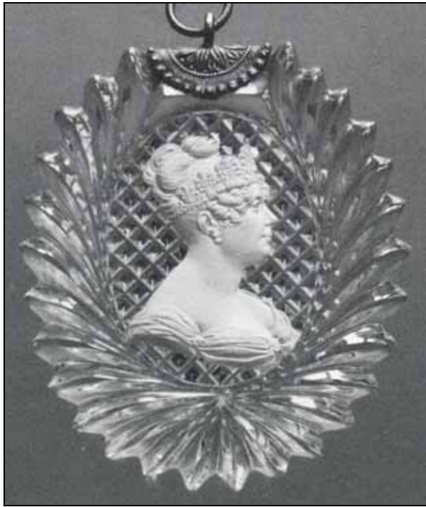
Abb. 2009-4/039 Goldmedaille Desirée Bernadotte-Clary, um 1818? DESIDERIA SVERIGES OCH NORRIGES DROTTNING bis 1796 Verlobte Napoleon Bonapartes, 1798 Hochzeit mit General Jean-Baptiste Bernadotte, 1818 als Karl XIV. König Johann von Schweden sign. Barre, verwendet als Belohnungsmedaille 1853 http://www.muenzauktion.com/wallinmynt/item.php5?id=1664