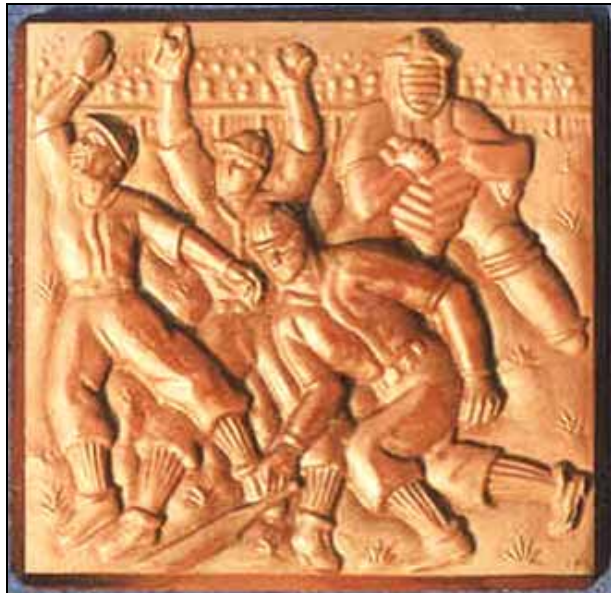
Abb. 2003-1/075 Reliefglasplatte „Rugby“ kristall, rosa-, rauch-, topas-farbenes und hellblaues sowie opak-elfenbein-, opak-jade-, opak-korall-farbenes und opak-rotbraunes Pressglas L / B 9 x 8,7 cm, keine Marke Sammlung Stopfer Entwerfer unbekannt Heinrich Hoffmann, Gablonz a.d.N., 1930-er Jahre

In meinem Artikel „ Reliefglasplatten der Firma Heinrich Hoffmann “ in PK 2003-1 , S. 49-60, und auch im Beitrag „ Versuch zur Unterscheidung von Vor- und Nachkriegserzeugnissen der Firma Heinrich Hoffmann “ in PK 2006-3 , S. 314-320, werden etliche Vorkriegsobjekte in den opaken Farben jade, lapis, korall, türkis und dunkelrotbraun (bis fast schwarz) gezeigt, wobei alle Reliefglasplatten vor H. Hoffmanns Tod 1939 produziert wurden.