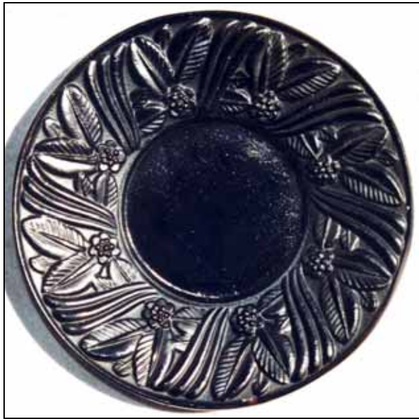
Abb. 2006-4/172 → Tasse mit Vogel-Muster (Kakadu?) Teller mit Blätter-Bänder-Muster opak-elfenbein-farbenes Pressglas Sammlung Hanisch Heinrich Hoffmann, Gablonz [Jablonec], 2. Hälfte 1930-er Jahre Entwurf A. Pfohl