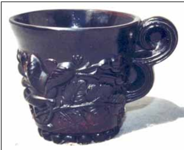
Abb. 2006-3/297 Tasse mit Brombeeren(?) -Muster opak-schwarz-braunes Pressglas , H 6,3 cm, D 6,5 cm Sammlung Stopfer Heinrich Hoffmann, Gablonz [Jablonec], 2. Hälfte 1930-er Jahre Entwurf A. Pfohl