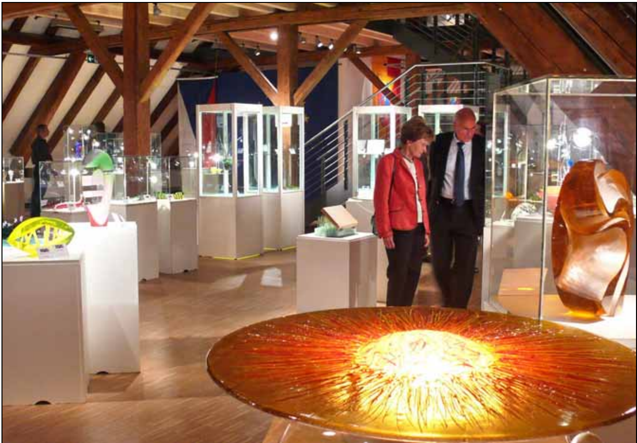
Abb. 2010-4/336 Nachwuchsförderpreis der Glasstadt Zwiesel 2009