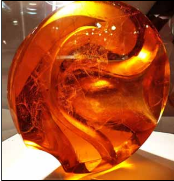
Abb. 2010-4/338 Nachwuchsförderpreis der Glasstadt Zwiesel 2009

Die Bewerbungsunterlagen können als Download im Internet unter www.zwiesel-tourismus.de , oder www.glastage-zwiesel.de abgerufen werden. Sie müssen bis 30. April 2011 bei der Kur- und Touristik Information in Zwiesel eingereicht sein. Die Anmeldung wird per eMail erbeten: MAIL: karin.fuchs@zwiesel.de