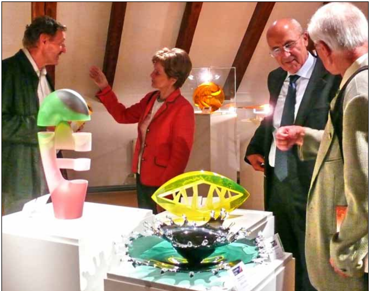
Abb. 2010-4/339 Nachwuchsförderpreis der Glasstadt Zwiesel 2009

Die Bewerbungsunterlagen können als Download im Internet unter www.zwiesel-tourismus.de , oder www.glastage-zwiesel.de abgerufen werden. Sie müssen bis 30. April 2011 bei der Kur- und Touristik Information in Zwiesel eingereicht sein. Die Anmeldung wird per eMail erbeten: MAIL: karin.fuchs@zwiesel.de