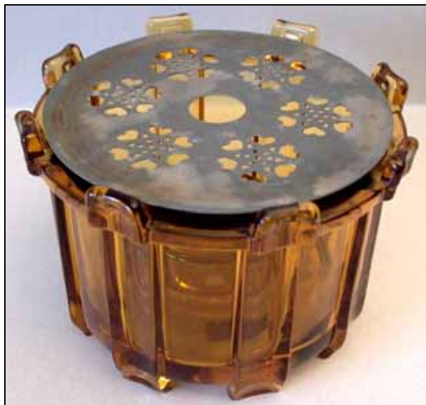
Abb. 2010-4/150 Stövchen mit Teelicht und Metalldeckel braunes Pressglas, H 9 cm, D 13 cm Sammlung Hott gefunden in Wales, 1980-er Jahre Hersteller unbekannt, England

Es war ein STÖVCHEN! Der Händler hatte immer noch keine Ahnung und überließ uns die Teile für Pen-ce-Beträge. Zu dieser Zeit kannte man in englischen Haushalten nur „gute alte“ Teekannenwärmer aus wattierten Textilien. Als wir unserer Gastgeberin den Fund präsentierten und den Verwendungszweck erklärten, fragte sie ganz konsterniert: „ You boil the tea??? “ ... Inzwischen dient das Stück bei uns sogar als Windlicht mit schönen Lichtreflexen an der Decke.